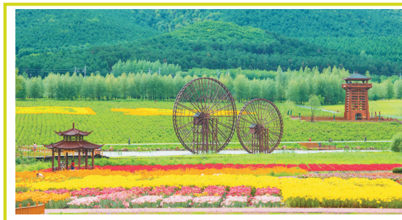
郊区大来岗国家森林公园达勒花海景区。