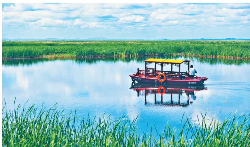
富锦国家湿地公园。