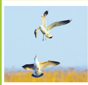
良好的生态环境吸引鸟类迁徙栖息。