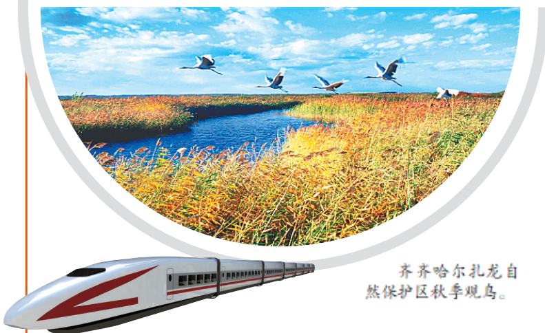
齐齐哈尔扎龙自然保护区秋季观鸟。

如今,我省已经进入“高铁时代”,坐着高铁去旅行成为龙江人周末休闲的时尚方式。乘坐高铁抵达哈尔滨感受异域风情与城市之美,尽享五花山色;在哈大齐高铁线路上,体验油城的厚重,感受鹤乡的精彩;在哈佳高铁线路上,走进神奇罗勒密,沉浸在醉美萝北;在哈牡高铁线路上,感受亚布力多彩之秋,一览镜泊湖胜景,游览生态小九寨;在牡佳高铁线路上,游览神秘珍宝岛,感受大美兴凯湖……今秋,24条高铁游线路让游客在“龙江速度”中领略五光十色的山海,以及沧海桑田的巨变。