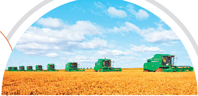
佳木斯建三江万亩大地号。

金秋九月,大自然的神奇画笔,在龙江大地上勾勒出诗情画意,一幅五彩斑斓的画卷从北向南依次铺开。