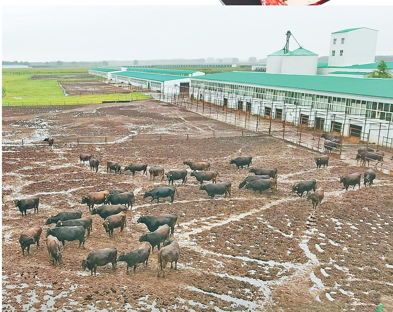
齐齐哈尔龙江县元盛公司和牛养殖饲养场。

三是产业链条齐备。消费者在烤肉中吃出了炽热温度和激情活力,品尝到了幸福滋味,而这座城市因为烤肉形成了产业,形成了上下游产业链条。在齐齐哈尔,烤肉的相关配套设施完善,