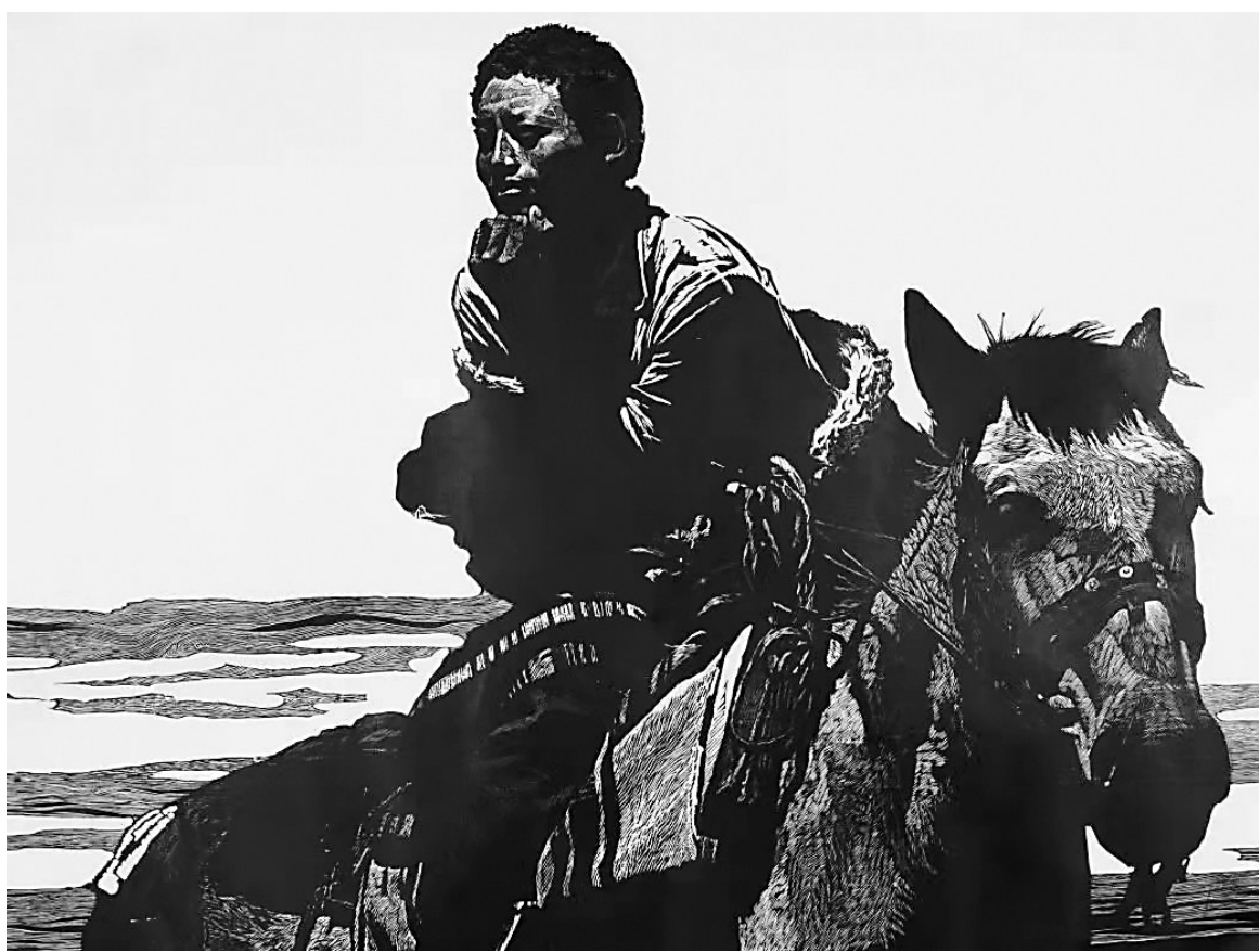
《在那遥远的地方》(版画) 徐匡