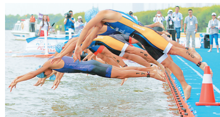
在松花江进行的铁人三项比赛。