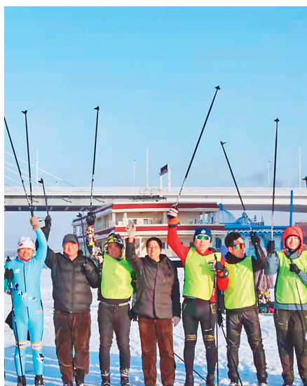
冬季铁人三项赛进行赛前培训。