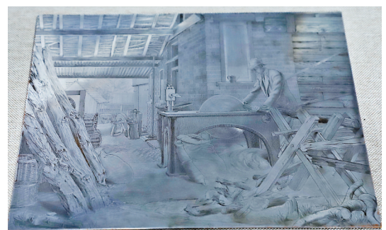
《冬季日志》(英国铜版原版) 威廉·华盛顿

一一览表(1980-2019)”,诉说着黑龙江版画在全国和国际重要美展中的璀璨辉煌。