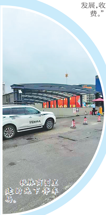
铁林街附近这里的地下停车场。