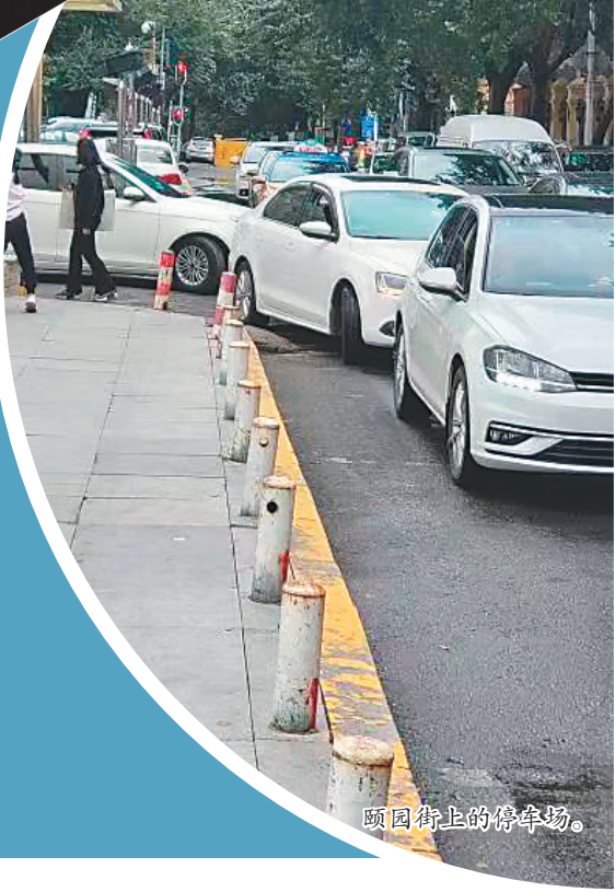
前津街上的停车场。