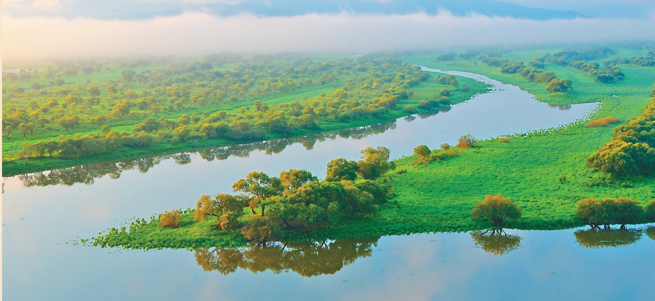
饶河乌苏里江国家湿地公园。

雁窝岛湿地是全国保存最完整、最具代表性和原始性的沼泽性湿地。雁窝岛核心区面积 119.2 平方公里,容纳了从低等到高等植物 500 余种,鸟种 25 种,鸟类 189 种。其中国家一级保护鸟类有丹顶鹤、白枕鹤等,国家二级保护鸟类有鸿、大天鹅、白额雁等。鱼类共 23 种。2002 年被评为国家级自然保护区,2010 年被评为黑龙江省 100 个最值得去的地方,2012 年获得“全国十大亲水美景”称号。2013 年雁窝岛旅游景区晋升为国家 AAAA 级旅游景区。2016 年获得黑龙江十大最美湿地称号。