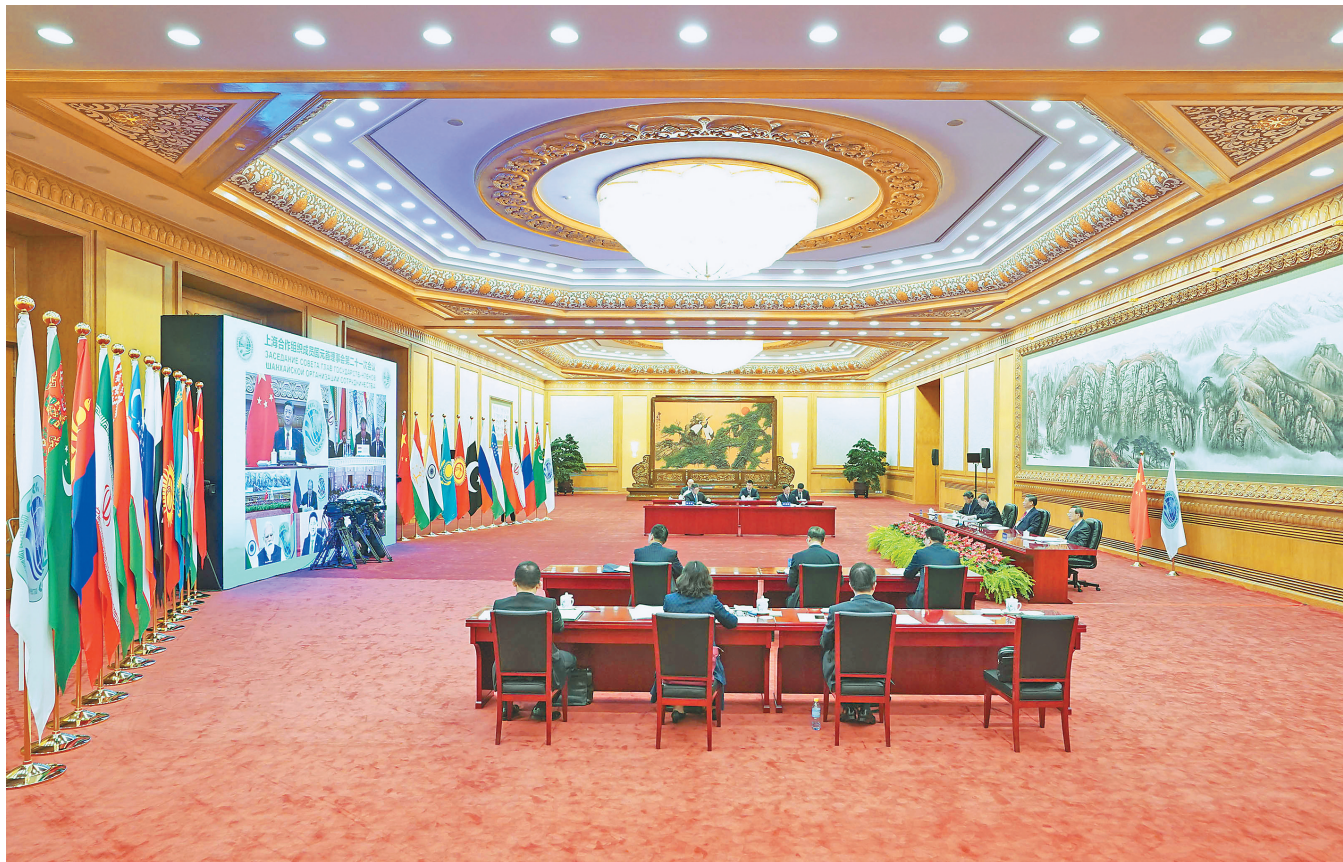
9月17日,国家主席习近平在北京以视频方式出席上海合作组织成员国元首理事会第二十二次会议并发表重要讲话。

新华社北京9月17日电 国家主席习近平17日下午在北京以视频方式出席上海合作组织成员国元首理事会第二十二次会议并发表题为《不忘初心 砥砺前行 开启上海合作组织发展新征程》的重要讲话。