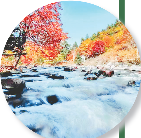
五花山色间溪水叮咚。

伊春市文广旅局赴广东茂名,以“秋色正茂,伊见倾心”为名,举行一场伊春旅游推介会。流光溢彩的五花山色,诚意满满的优惠政策让推介会收获满载,吸引更多茂名及广东客源赴伊春旅游。