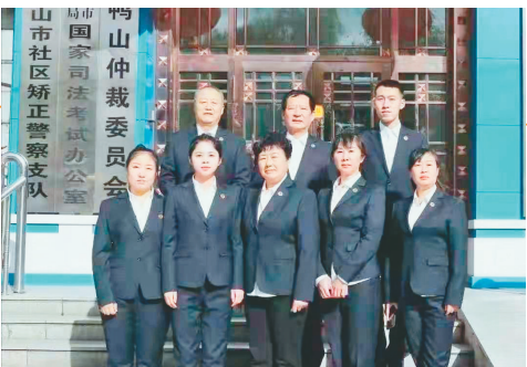
非诉中心调解团队。

据统计,该中心自2020年5月22日成立以来,一年多的时间已化解矛盾纠纷1562件,标的额近6700万元,成功率96.3%;化解人身死亡赔偿案件、群体性矛盾纠纷等重大疑难案件213件,打造了具有双鸭山特色的非诉讼纠纷化解新模式。