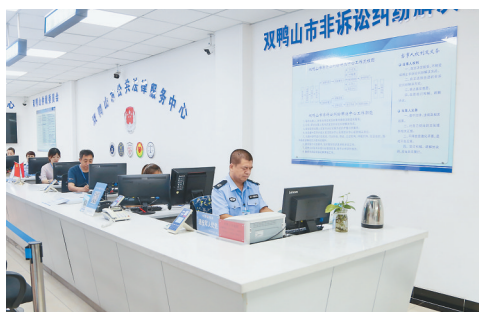
双鸭山市非诉讼纠纷解决中心服务大厅。