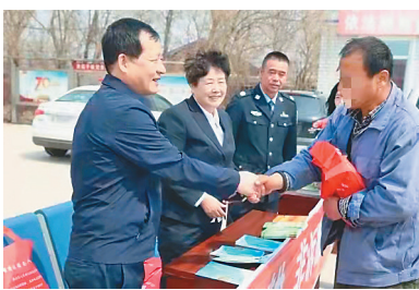
调解员到基层宣传。

据双鸭山市尖山区人民法院党组成员、副院长闫伟东介绍,司法局的非诉中心与人民法院的诉前调解体系相衔接,共同构建调诉无缝对接快速通道。该中心成立以来,受理尖山区法院移交的纠纷226件,相当于该法院民事诉讼案件的十分之一,化解成功率