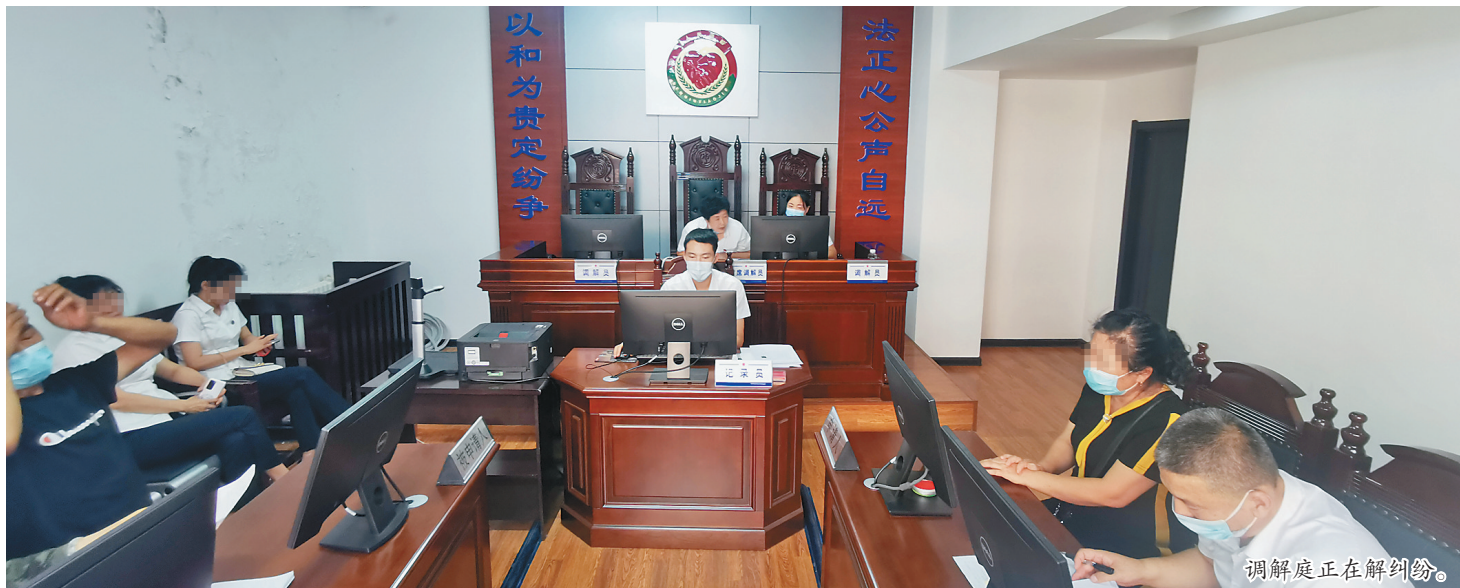
调解庭正在解纠纷。