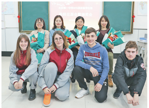
大庆一中 AFS 项目留学生班。

甲子峥嵘,华章再续。“大庆一中将以60周年校庆为契机,紧扣立德树人根本任务,办好人民满意教育,为把大庆一中建设成集团化、特色化、国际化的一流名校而努力。”大庆一中校长吕占国说。