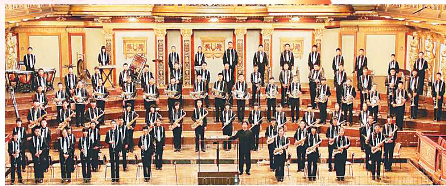
大庆一中学生管乐团在“金色大厅”举办音乐会。

倾听着石油会战号角起航,踏着铁人王进喜脚步前行,大庆一中逐渐形成了“以大庆精神办学、用铁人精神育人”的办学理念。2011年6月,大庆一中原初二(15)班被教育部命名为“王进喜班”,学校以此为契机,开展了主题为“了解名人、学习名人、争做名人”的励志文化建设活动。各个班级选定所要学习的名人、楷模为自己的班级命名,开展形式多样的活动,宣传名人、楷模的优秀事迹,以榜样的力量带动全体学生共同进步。全国最美中学生、省市级三好学生、市级优秀团干部、龙江最美少年不断涌现,学铁人、做铁人在校园里蔚然成风。“踏着铁人脚步走”,一代又一代师生辛勤耕耘,艰辛探索,锐意改革。