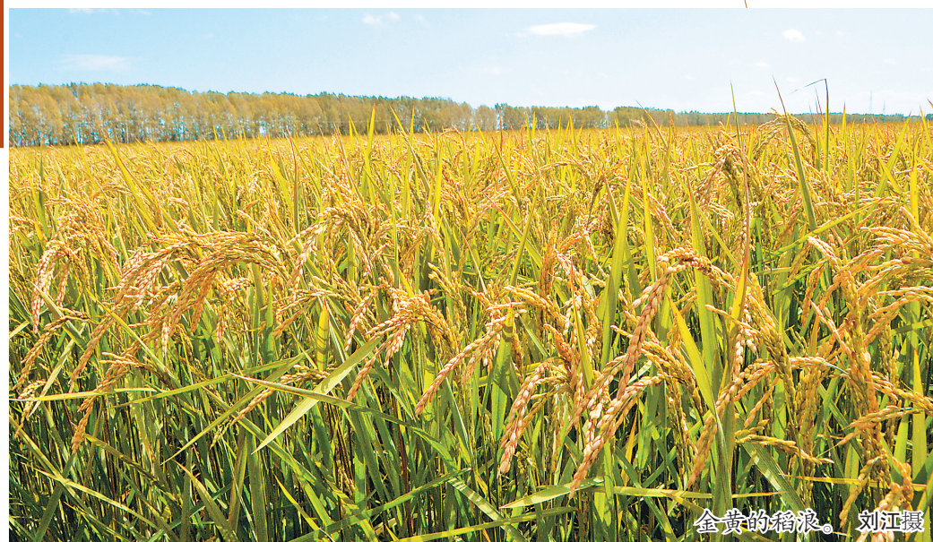
金黄的稻浪。

8月25日,“中国石油”对外宣布,大庆油田发现预测地质储量12.68亿吨页岩油,标志着我国页岩油勘探开发取得重大战略突破。人们发现,此次披挂出征的仍然是那支铁军——