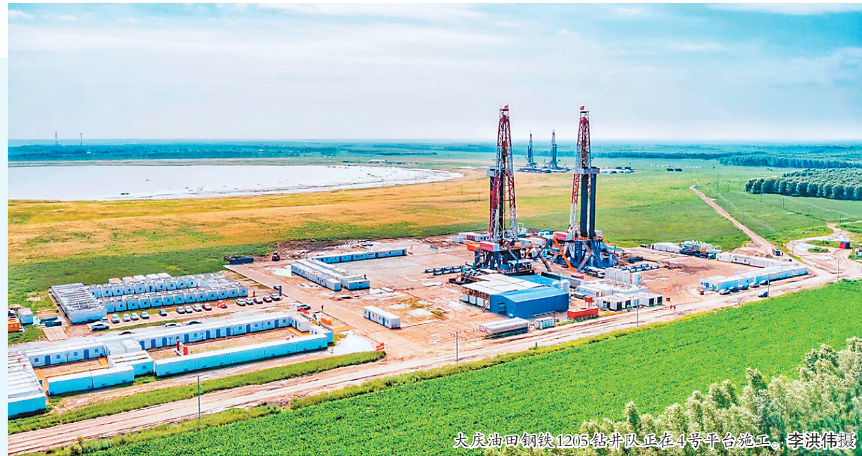
大庆油田钢铁1205钻井队正在4号平台施工。

此时1205队正在打第6口页岩油井,用钻机的怒吼、科学的引擎,向世界宣告:要干,就干别人干不了的;要争,就要把旗帜插上主峰!这是68年来,1205队一直坚持的工作作风。