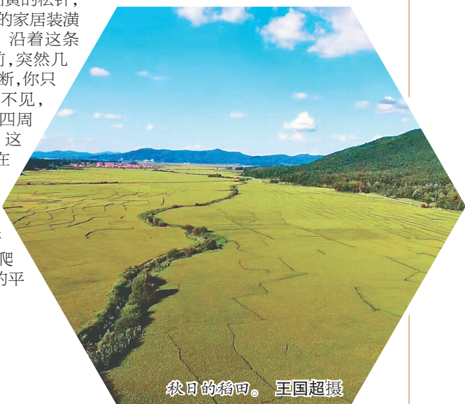
秋日的稻田。

一阵微风吹来,眼前的水稻摇头摆尾,似万顷碧波向杏花山涌去。我的耳边仿佛传来“稻花香里说丰年”的朗朗词声。当我放眼望去,突然觉得被稻花香包裹和浸润着的杏花山格外美丽!