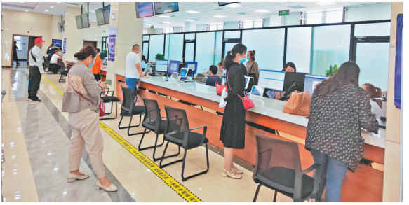
虎林市政务服务中心。

本报讯(刘吉盛 陈敏 黑龙江日报全媒体记者孙伟民 刘柏森)近日,全省2020年度营商环境评价报告出炉,虎林市在评价的15项一级指标中有10项高于参评县(市)平均值,综合得分处于全省前列。 在借鉴世界银行营商环境评价指标体系、国家发改委评价指标体系、部分学术研究机构和管理咨询机构发布的指标体系基础上,评价团队以国家和《黑龙江省优化营商环境条例》为基础,从衡量企业生命周期、区域投资吸引力和政府服务与监管等三个维度出发,设计了我省营商环境评价指标体系。该体系包含3个维度、21个一级指标和101个二级指标。评价的时间区间为2019年5月1日到2020年10月31日,评价对象为全省13个市(地)及其各自推选的一个县(市)。