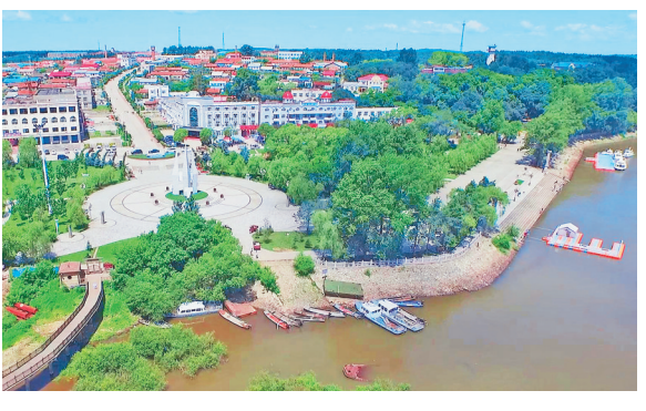
虎头村远眺。

本报讯(刘吉盛 黑龙江日报全媒体记者孙伟民 刘柏森)近日,农业农村部发布了拟认定第二批全国乡村治理示范村镇候选名单公示公告,虎林市虎头镇虎头村入选全国100个乡(镇)和1000个村名单。 近年来,虎头村通过新增资源有偿使用,集体资源对外发包,争取项目扶持资金等形式,推动村集体经济稳步提升。特别是依托国家5A级景区的发展热潮,鼓励农户利用闲置资源开办家庭旅馆、民宿、农家乐、渔家乐、水上乐园等,增加收入同时进一步提升了村民的幸福感和满足感。