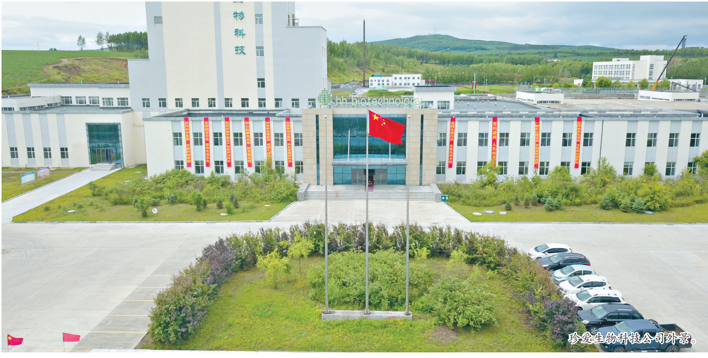
珍爱生物科技有限公司外景。

本报讯(黄新星 付佳 黑龙江日报全媒体记者孙伟民 刘柏森)秋收在即,密山市开展了“金秋季 畅通行”城乡道路修缮治理大会战。 近期,在密山市各乡镇通往村的主干道上,多台大型机械正在紧张有序地进行路面铺设作业,大型平地机对“沙质”路面和混凝土路面的路肩进行整平。 会战中,仅太平乡核心村就使用钩机垫路肩,投入资金24400元,维修农田路2.3公里,投入资金15750元;庄内村动用大小钩机三台,翻斗车六辆,农用拖拉机28辆,修建农田路4.6公里,投入资金36000元;连珠山镇沙岗村修缮道路8公里。 在密山城区与密兴高速路接轨处有一段路地势低洼、坑凸不平。在此次会战中,经过5天奋战,将坑洼路面修缮成水泥路。 密山两景区获国家级旅游专家组好评 本报讯(黑龙江日报全媒体记者孙伟民 刘柏森)近日,国家级旅游专家组一行抵达密山市,对新开发、白鱼湾、当壁镇3个景区打捆创建兴凯湖省级旅游度假区进行评定,并对密山市北大荒书法长廊、兴凯湖当壁镇景区2个国家4A级旅游景区进行评定性复核。 专家组先后来到了北大荒书法长廊、农垦兴凯湖当壁镇景区、白鱼湾镇湖沿民宿旅游村和兴凯湖新开流景区,对景区的环境建设、客服中心、旅游厕所、旅游标识、旅游经营管理、旅游安全、旅游服务等方面进行了全面复核检查。专家组对兴凯湖省级旅游度假区创建和北大荒书法长廊、兴凯湖当壁镇景区2家4A级旅游景区标志化建设工作给予充分肯定。 据介绍,下一步,密山市将持续对4A级旅游景区的达标建设、管理与服务、安全与卫生、住宿与餐饮、参与项目投入、活动创新、智慧旅游等方面进一步完善和提高,努力实现旅游高质量发展,满足游客更高层次的旅游需求。