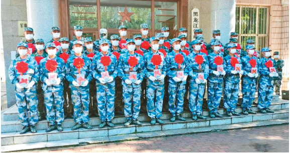
仪式现场。

本报讯(黑龙江日报全媒体记者孙伟民 刘柏森)9月17日,鸡东县举行2021年度新兵入伍欢送仪式。34名鸡东好男儿承载着家乡父老的希望和嘱托,启程奔赴军营。 当日9时许,在县人武部门前,朝气蓬勃、意气风发的人入伍新兵身着戎装、胸带红花,英姿飒爽、整装待发,一张张年轻的脸庞上,写满了对军旅生活的憧憬和向往。