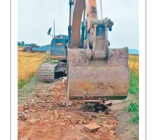
乡村道路修缮现场。

本报讯(黄新星 付佳 黑龙江日报全媒体记者孙伟民 刘柏森)秋收在即,密山市开展了“金秋季 畅通行”城乡道路修缮治理大会战。 近期,在密山市各乡镇通往村的主干道上,多台大型机械正在紧张有序地进行路面铺设作业,大型平地机对“沙质”路面和混凝土路面的路肩进行整平。 会战中,仅太平乡核心村就使用钩机垫路肩,投入资金24400元,维修农田路2.3公里,投入资金15750元;庄内村动用大小钩机三台,翻斗车六辆,农用拖拉机28辆,修建农田路4.6公里,投入资金36000元;连珠山镇沙岗村修缮道路8公里。 在密山城区与密兴高速路接轨处有一段路地势低洼、坑凸不平。在此次会战中,经过5天奋战,将坑洼路面修缮成水泥路。 密山两景区获国家级旅游专家组好评 本报讯(黑龙江日报全媒体记者孙伟民 刘柏森)近日,国家级旅游专家组一行抵达密山市,对新开发、白鱼湾、当壁镇3个景区打捆创建兴凯湖省级旅游度假区进行评定,并对密山市北大荒书法长廊、兴凯湖当壁镇景区2个国家4A级旅游景区进行评定性复核。 专家组先后来到了北大荒书法长廊、农垦兴凯湖当壁镇景区、白鱼湾镇湖沿民宿旅游村和兴凯湖新开流景区,对景区的环境建设、客服中心、旅游厕所、旅游标识、旅游经营管理、旅游安全、旅游服务等方面进行了全面复核检查。专家组对兴凯湖省级旅游度假区创建和北大荒书法长廊、兴凯湖当壁镇景区2家4A级旅游景区标志化建设工作给予充分肯定。 据介绍,下一步,密山市将持续对4A级旅游景区的达标建设、管理与服务、安全与卫生、住宿与餐饮、参与项目投入、活动创新、智慧旅游等方面进一步完善和提高,努力实现旅游高质量发展,满足游客更高层次的旅游需求。