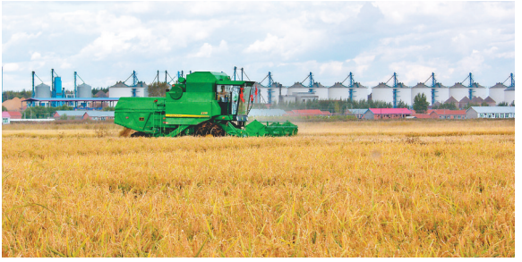
收割金黄的水稻。

本报讯(陈敏 黑龙江日报全媒体记者孙伟民 刘柏森)近日,虎林市被定为全国水稻绿色高质高效行动示范县。 为在更大规模、更高层次开展绿色高质高效行动,省农业农村厅、省财政厅决定在全省建设全国粮油(经济作物)绿色高质高效行动示范县。经过专家评审,全省有23个县(市、区)被确定为全省建设全国粮油(经济作物)绿色高质高效行动示范县,虎林市被定为全国水稻绿色高质高效行动示范县之一。 近年来,虎林市一直坚持以绿色理念指导农业现代化发展,通过打造绿色科技园区、推广绿色技术模式、发展绿色食品加工,走出了以绿色现代农业带生产、促加工、富民民的绿色生态农业发展之路,建设了水稻绿色高标准示范园区11个,带动142万亩水田实现绿色高效种植。