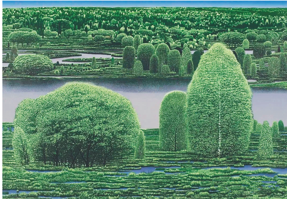
刘德才《春水吟》 套色木刻 92x132cm 2017年

生在这块土地上的人,天生就是农民。他像农民一样热爱生他养他的这片土地。像种子一样感受着这块土地的温情。