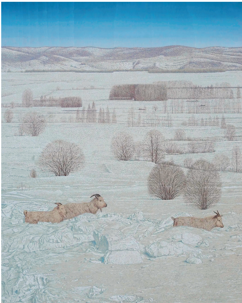
刘德才《刻在北大荒的土地上之三》 插图 47x36cm 2014年