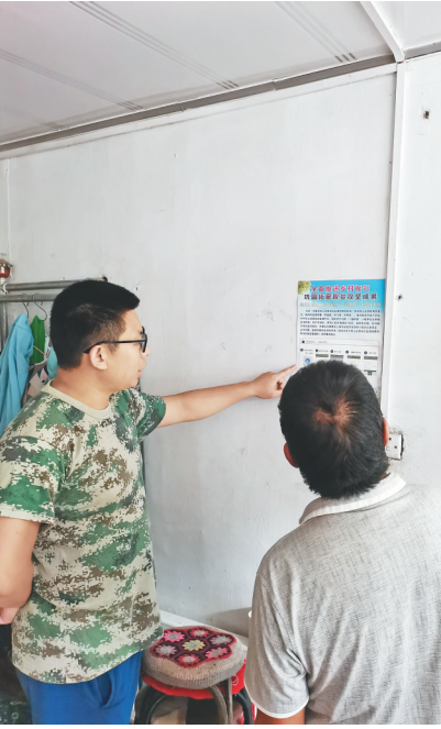
讷河市和盛乡农乐村驻村工作队入户宣传“一键申报”。

积极引导村妇联组织、驻村工作队和老党员、有威望的群众，通过微信群、入户走访、集中座谈等方式，努力扩大孝心养老知晓率，提高子女履行赡养义务的积极性。鼓励党员、教师、村屯干部等带头交纳赡养费，以良好的示范作用带动他人。进一步发动村民、帮扶责任人及家乡在外人士奉献爱心，捐献资金，引导全民孝善的社会氛围。对赡养费资金进行专人专户管理，防止坐收坐支和挤占挪用，建立台账，登记造册，张榜公布。截至目前，全市16个乡镇（街道）赡养费已全部收缴发放完毕。