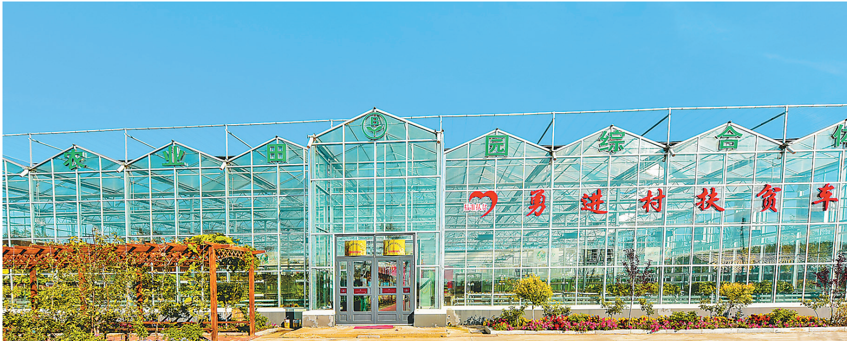
↑讷河市龙河镇勇进村太阳能日光温室。