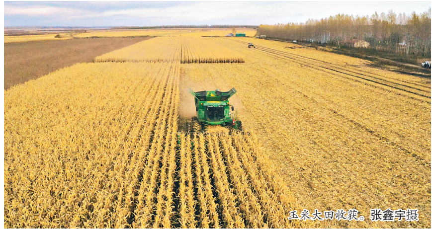
玉米大田收获。

“根据测产情况,今年亩产可达1200斤,比去年增加200斤,又是一个丰收年。” 据悉,绥化市水稻种植面积超过530万亩。为了保护土壤肥力,绥化市采取全量秸秆还田的保护性耕种方式。在联合收割机过后,地里只剩下大约10厘米左右水稻茬,其余的水稻秸秆都被粉碎,便于下一步秸秆还田作业。 大豆 走标准化产业化之路 在国家A级绿色食品大豆基地、绥化地区重要的大豆购销集散地——绥化市北林区兴福镇,联合收割机正在井然有序地进行大豆收割作业。所到之处大豆被连根拔起,一粒粒“金豆子”被收到了“粮袋子”。 (下转第三版)