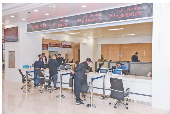
服务窗口办事流程完全透明。

为方便市民停车,市民中心门前和东侧广场配备了420个停车位,办事群众车辆均可免费停放。