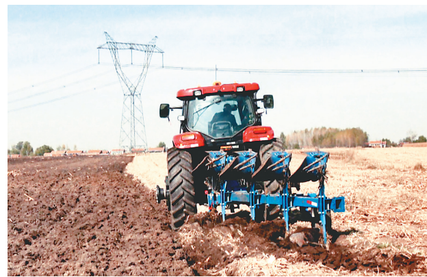
拖拉机正在进行秋翻地作业。

本报讯(杨娜 黑龙江日报全媒体记者潘宏宇)七台河市在秋收工作中多措并举人机齐动抢农时,做到秋收一块、整地一块,用最快速度实现黑色越冬。