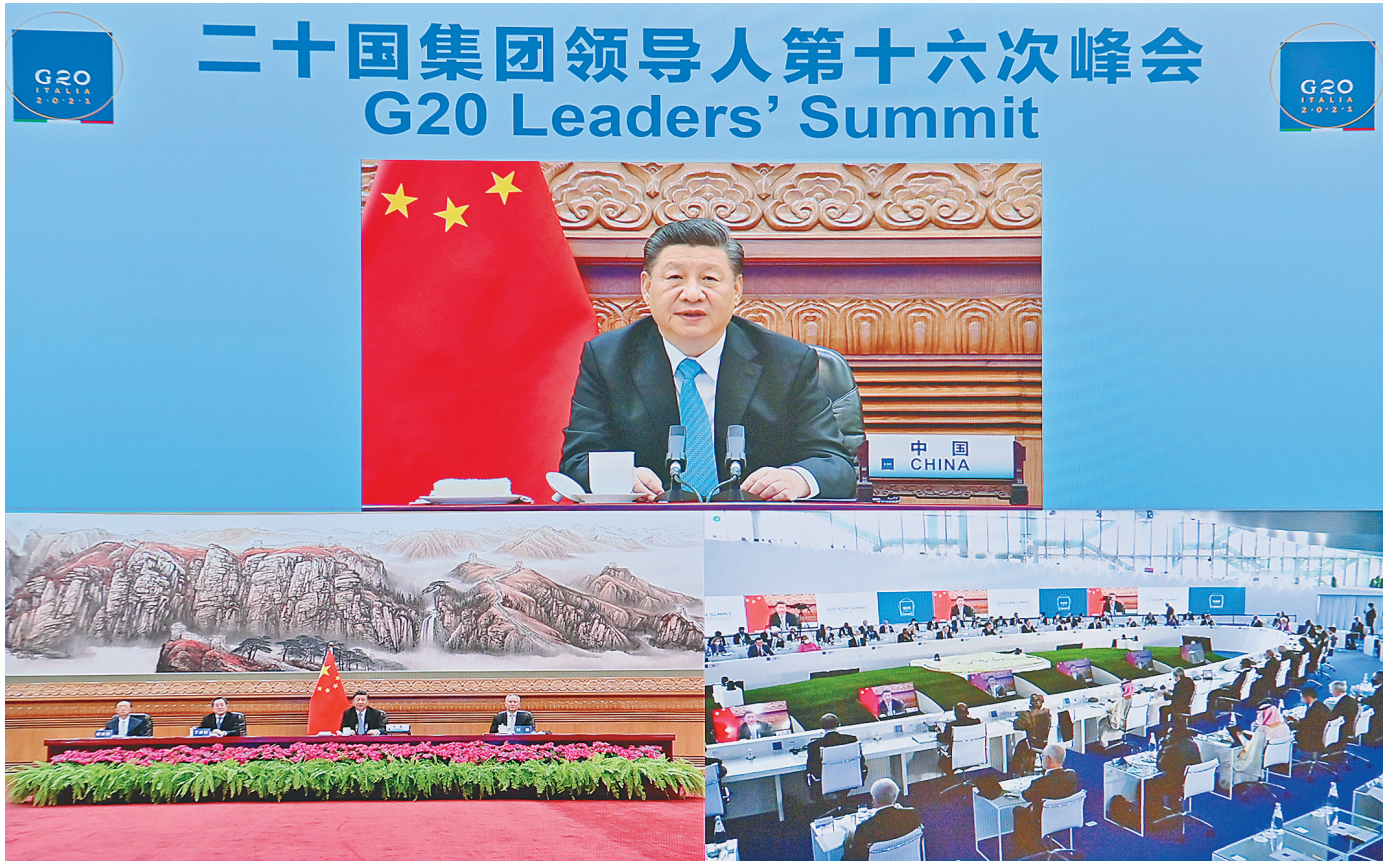
10月31日晚，国家主席习近平在北京继续以视频方式出席二十国集团领导人第十六次峰会。