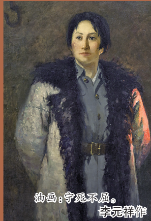
油画:守死不屈, 李元祥作