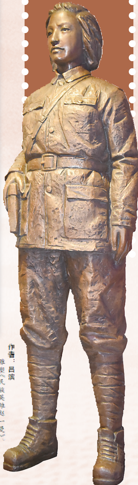
作者:吕滨 雕塑:民族英雄赵一曼