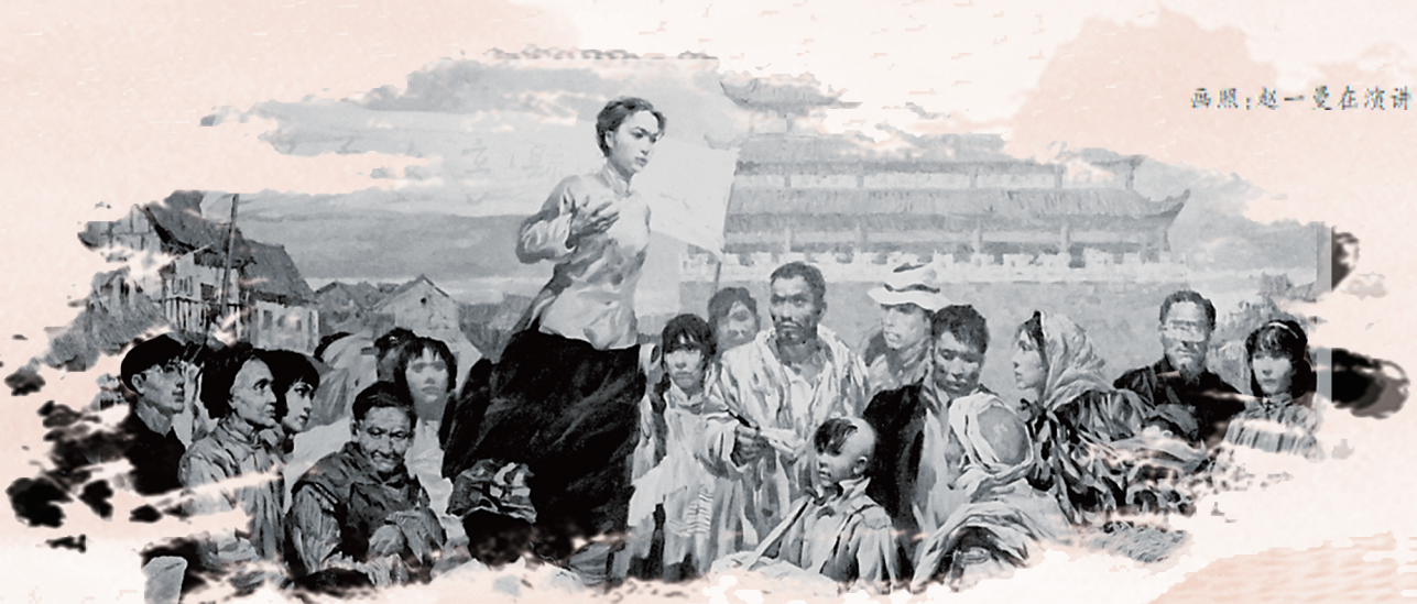
画照:赵一曼在演讲。

敌人再次审讯,特务头子林宽重大施淫威,大逼压木杠、皮鞭抽、灌凉水、用火烤、跪砖头等各种酷刑,妄图令其招供,迫使她投降,但赵一曼宁死不屈,以钢铁般意志与敌人进行顽强抗争。敌人见毫无争取的可能,最后决定将其处以死刑。