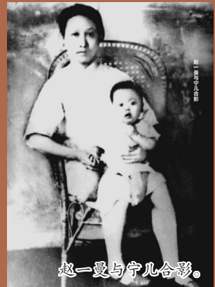
赵一曼与宁儿合影。