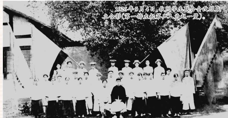
1926年5月4日,徽州学生联合会改组成立合影(第一排左起第二人为赵一曼)。

1935年,在敌人的“大讨伐”中,哈东各县抗日根据地遭受严重破坏,抗日军民损失数以千百计,一时间,“血染帽儿山,尸填乌吉密”。面对敌人惨无人道的“大讨伐”,赵一曼组织群众躲避敌人烧杀,带领铁北游击队配合第三军二团在道北地区与敌军周旋,寻敌薄弱,打击敌“讨伐队”。