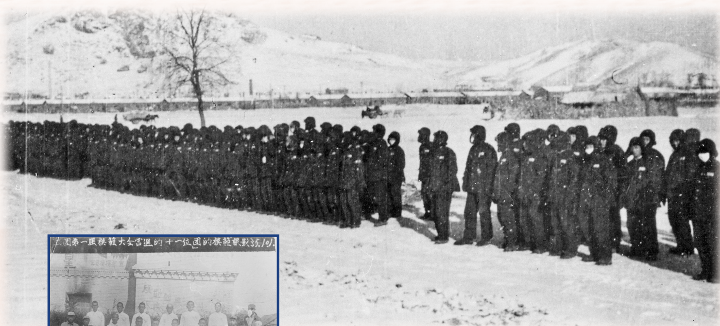
↑杨子荣与战友雪地集结。 ←模范大会当选的模范,后排左起第三人为杨子荣。