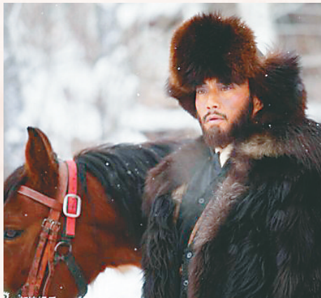
电影《智取威虎山》剧照。