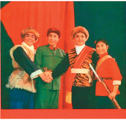
京剧《智取威虎山》剧照。

2014年12月,改编自曲波小说《林海雪原》的电影《智取威虎山》上映。该片由徐克执导,张涵予、梁家辉等主演。骁勇善战的解放军203小分队与土匪“座山雕”斗智斗勇的故事,吸引了广大影迷热切关注,英雄的传奇人生有力鼓舞了当代青年。