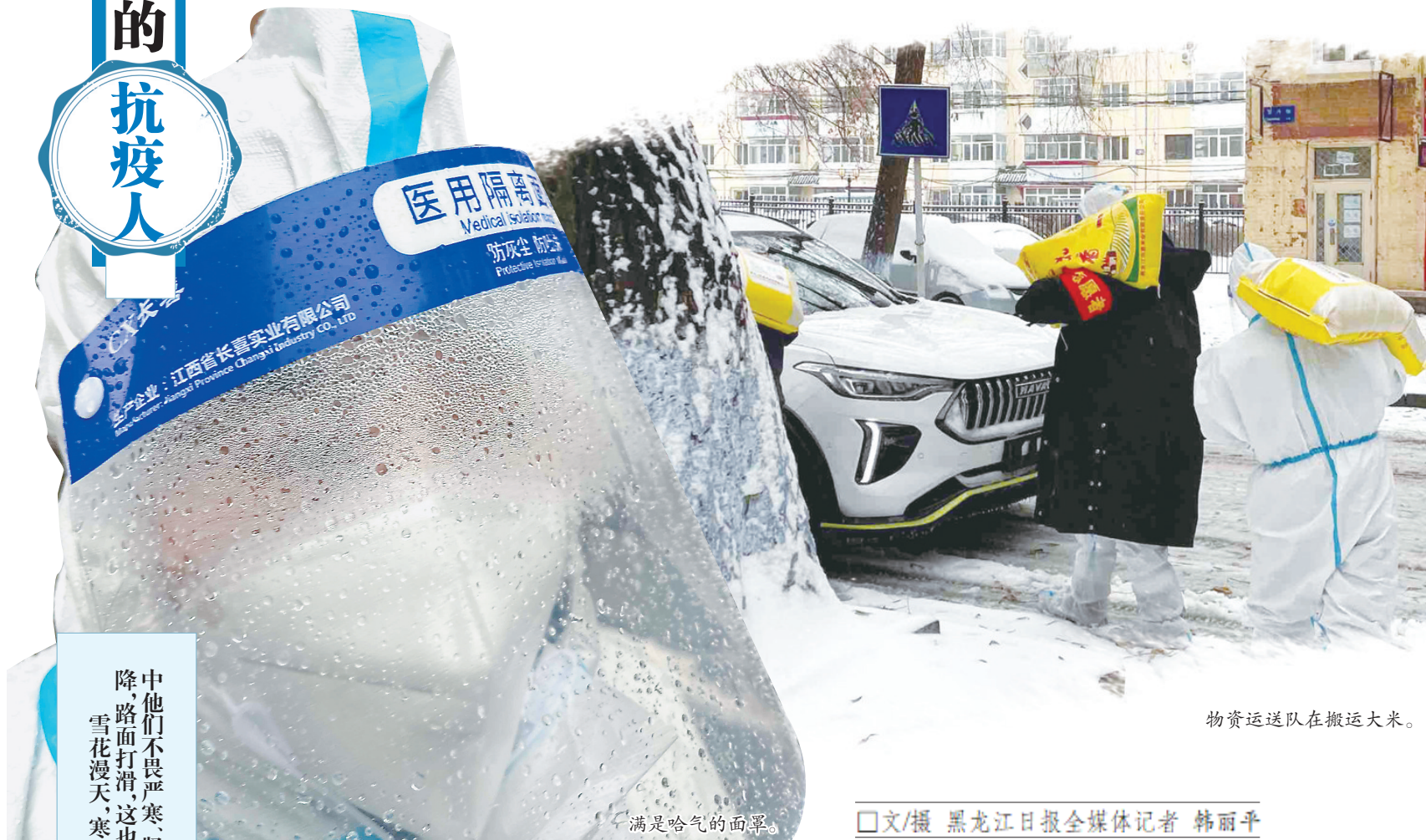
物资运送队在搬运大米。