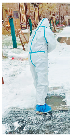
管控小区内清雪。