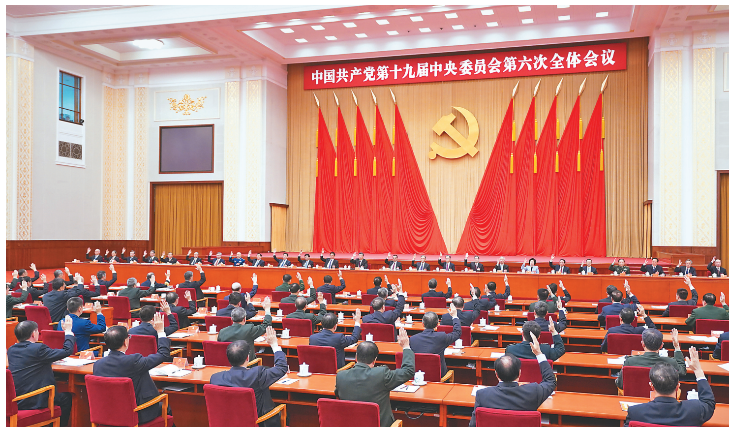
中国共产党第十九届中央委员会第六次全体会议,于2021年11月8日至11日在北京举行。中央委员会总书记习近平作重要讲话。