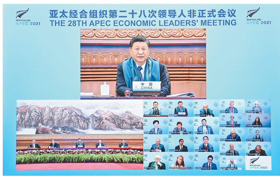
11月12日晚，国家主席习近平在北京以视频方式出席亚太经合组织第二十八次领导人非正式会议并发表重要讲话。