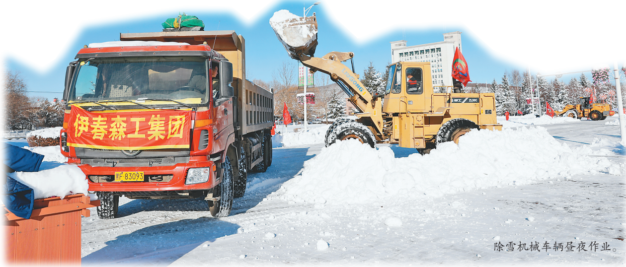
除雪机械车辆在雪夜作业。

近日,特大暴雪过程自南向北进入伊春。暴雪、雨夹雪,复杂的天气状况造成电线结冰、道路结冰、雪阻。市气象局统计,此次降雪过程中出现两项历史极值,伊春、嘉荫、铁力三个站点8日至9日单日降雪量突破历史极值、伊春站积雪深度达到历史极值。为应对这次历史罕见天气,伊春市委市政府“以雪为令”,强化责任,提前部署,与时间赛跑,全市应急响应从三级提升到二级、发布红色暴雪预警、采取中小學生线上教学、加强交通管制,第一时间开展清雪作业,一系列应对措施最大限度地降低了暴雪灾害天气带来的损失。