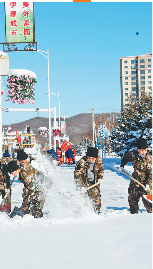
伊春森工集团的清雪队员发挥突击队作用,为中心城区清雪。

近日,特大暴雪过程自南向北进入伊春。暴雪、雨夹雪,复杂的天气状况造成电线结冰、道路结冰、雪阻。市气象局统计,此次降雪过程中出现两项历史极值,伊春、嘉荫、铁力三个站点8日至9日单日降雪量突破历史极值、伊春站积雪深度达到历史极值。为应对这次历史罕见天气,伊春市委市政府“以雪为令”,强化责任,提前部署,与时间赛跑,全市应急响应从三级提升到二级、发布红色暴雪预警、采取中小學生线上教学、加强交通管制,第一时间开展清雪作业,一系列应对措施最大限度地降低了暴雪灾害天气带来的损失。