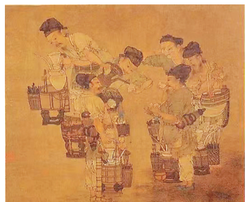
省博物馆馆藏南宋《斗浆图》。

本报讯(黑龙江日报全媒体记者董云平)“画风古朴、淡雅,画师设色重花青,衣褶处以铁线技法,刚劲有力,自然流畅,人物脸和手等细若游丝,和娴熟淡墨晕染……”日前,省博物馆首场“文物鉴赏”线上直播举行,开启了省内文物鉴赏线上直播的先河。