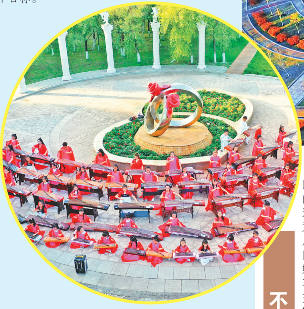
中俄边境文化季举办文化惠民活动。

同江市聚焦学史力行,把党史学习教育与解决问题、推动工作相结合,切实将党史学习教育成果转化为群众办实事的工作动力和实际成效,实现了学党史、悟思想、办实事、开新局的工作目标。