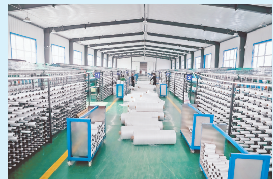
向阳镇蓝天网业公司发展乡村产业。