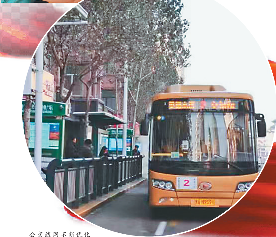
公交线网不断优化 提升百姓出行效率。