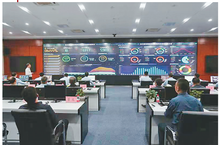
哈尔滨智能交通调度系统实时调配车辆。

年初以来,累计调研解决部分公交基础设施不够完善、公交服务质量不高、网约车管理不规范、常态化疫情防控措施落实不细不严等方面的问题230余个;累计调派各型保障车辆7191台,全力保障核酸检测样本、应急物资和重点人员转运,累计转运人员15218人次;2次抽调13名优秀党员干部下沉到松北区枫叶小镇等5个大型商超,督促和配合各大商超严谨细致地做好各项疫情防控工作,受到松北区有关部门高度赞扬。