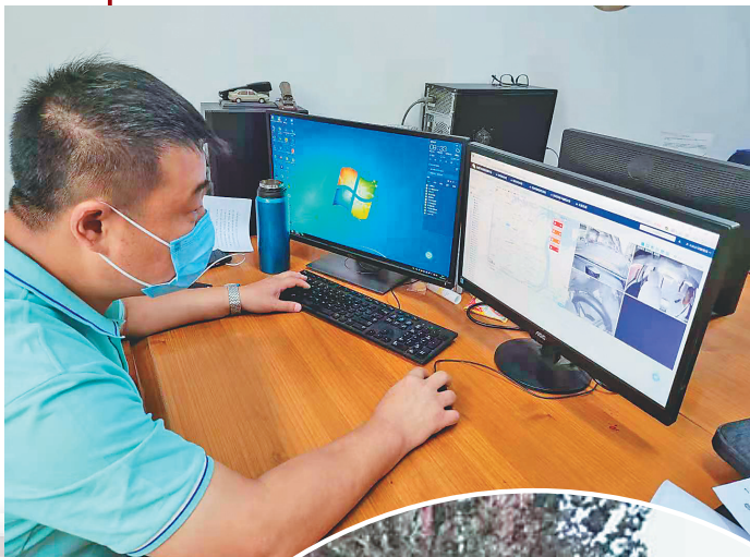
车载智能调度终端设备对车辆实时管控。