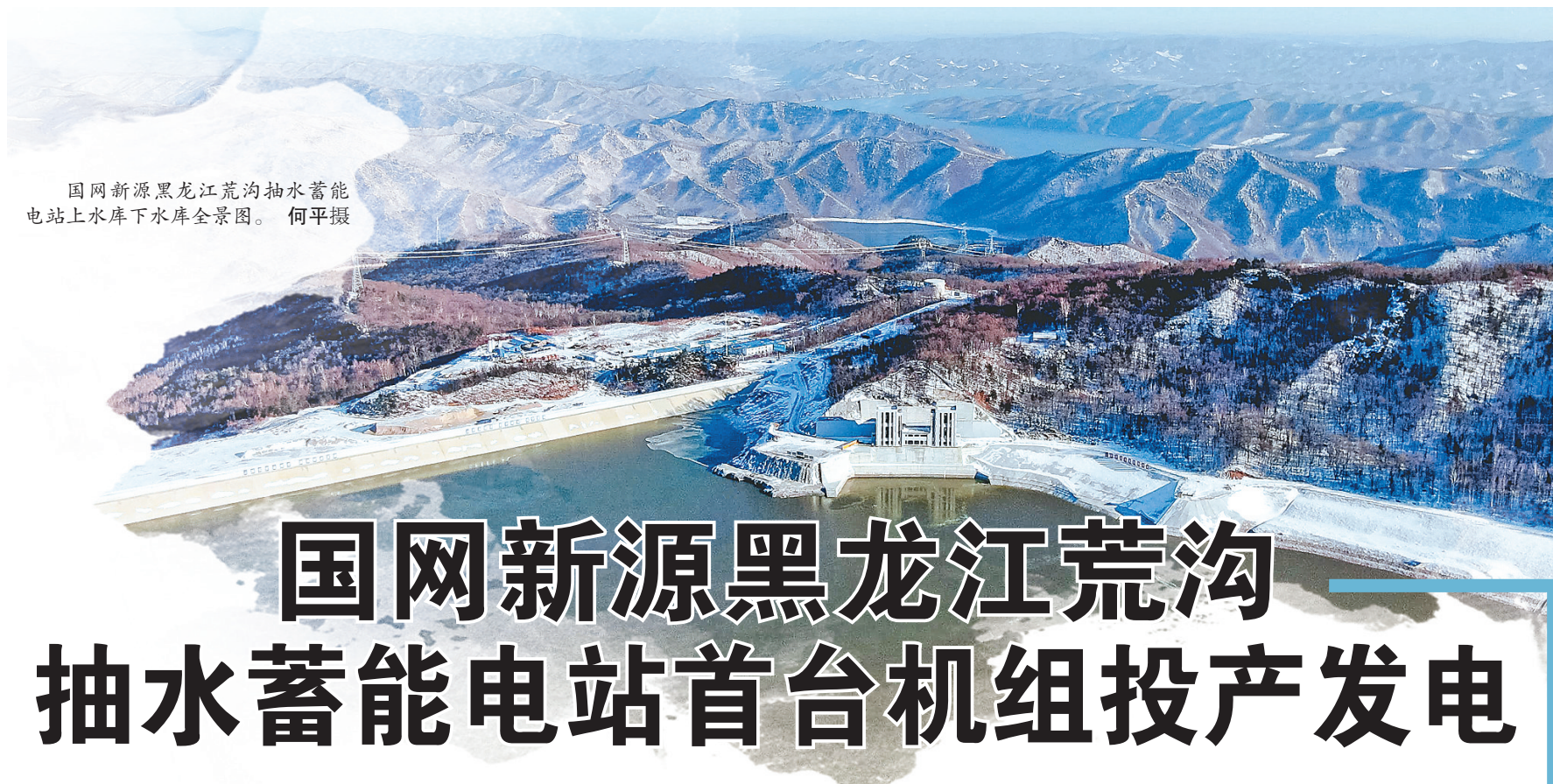
国网新源黑龙江荒沟抽水蓄能电站上水库下水库全景图。