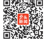
获奖单位和获奖个人名单 详见二维码

自本公告发布之日起60日内(哈尔滨市本轮疫情结束后),请获奖个人携带本人身份证原件,到哈尔滨市南岗区花园街161号中共黑龙江省委黑龙江省人民政府人民建议征集办公室领取获奖证书和奖品。委托他人领奖的,请携带获奖人身份证复印件、委托书及被委托人身份证,到指定地址领取,逾期未领取的将作弃权处理。优秀组织奖领取时间另行通知。