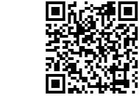
案件办理情况 扫码查询

各市(地)针对调查发现的违法行为,采取了责令整改、立案处罚、立案侦查、问责等措施。其中,责令整改8家、立案处罚11家、罚款金额1488.64万元、立案侦查5件、刑拘2人,问责14人。