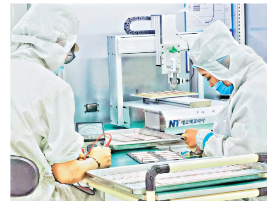
穆棱市北一半导体科技有限公司。