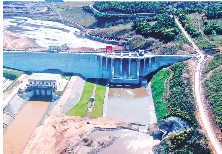
穆棱备斗水库下闸蓄水。