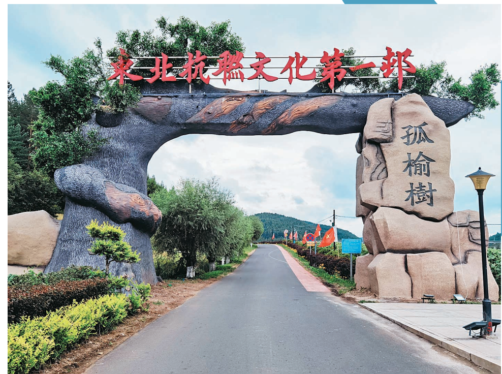
穆棱,东北抗联文化第一村——孤榆树村。