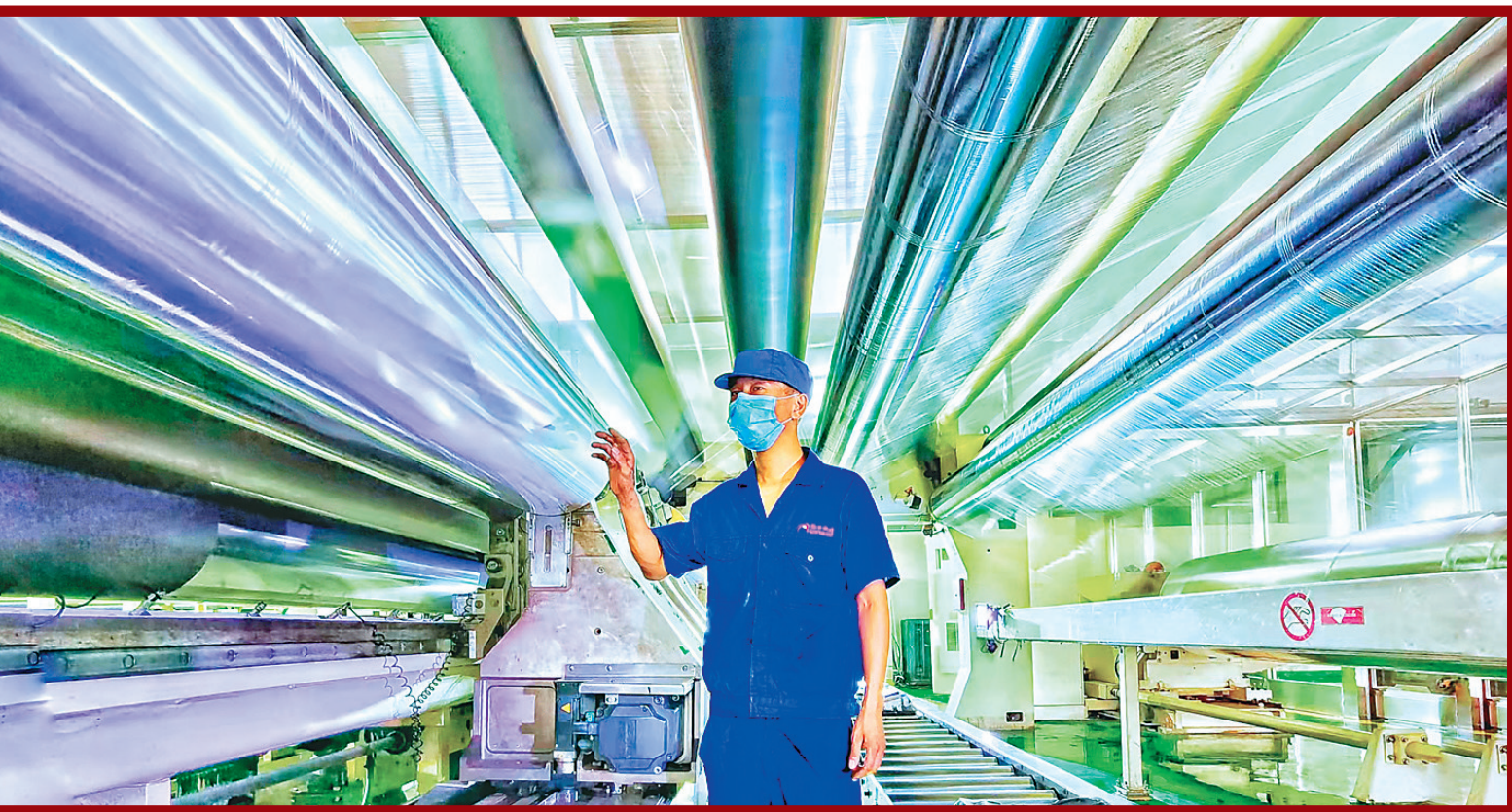
瑞丰新材料科技有限公司。

聚力城乡品质提升。坚持规划引领,做精城区、做强园区、做优片区、做美景区、做实社区。加快推进城市基础设施建设,完善城市管理长效机制,打造更加宜居宜业、精致精美的品质城区。开展乡村建设行动,打造一批产业富美、环境优美、文化尚美、生活和美、民风淳美的示范镇村。 补齐公共服务短板。全面强化稳就业举措,完善社会保障体系,坚持教育优先,加快养老产业发展,广泛开展全民健身活动。 提升社会治理效能。坚持自治强基、法治规范、德治教化“三治融合”,社区、社会组织、社会工作者“三社联动”,人民调解、行政调解、司法调解“三调并举”,发扬“五小五星”经验,强化网格化管理,加快构建具有穆棱特色、时代特征的城市治理模式。 发挥文化资源优势。着力涵养文化底藪,强化红色文化宣传教育,讲好穆棱红色故事、擦亮红色文化名片。着力发展文创产业,叫响“中国歌词创作之乡”文化品牌,推进穆棱全域旅游再提质再升级,不断满足人民日益增长的精神文化需要。 维护生态安全。大力推进全域生态保护修复,全面落实河湖长制、林长制,继续实施穆棱河生态补偿机制,推动城镇污水处理厂全覆盖,扎实推进“厕所革命”,推动污染防治在重点区域、重点领域、关键指标上实现新突破。 维护生命安全。慎终如始做好常态化疫情防控,加强公共卫生服务体系和重大疫情防控救治体系建设,切实筑牢保障人民群众生命安全和身体健康的坚固防线。