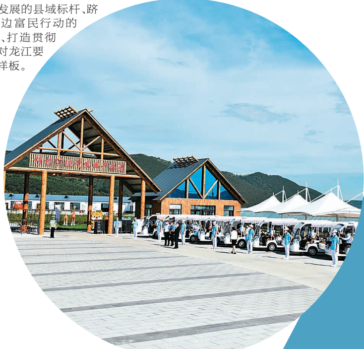
穆棱9°现代农业产业园。

新征程已经开启,赶考路就在脚下。 今后五年是穆棱实现县域经济高质量发展跨越式发展的关键五年,必须深刻把握新发展阶段新特征新要求,立足新起点、科学研判形势,准确把握方向。 今后五年,穆棱要继续紧紧围绕新发展理念,坚定不移走高质量发展之路。在常规经济指标年均增速持续保持领先的基础上,创新动能显著增强、开放水平稳步提高、城乡融合更加协调、生态质量明显改善、民生福祉全面提升,地区生产总值和财政收入总量进入全国边境县前十,城镇和农村居民人均可支配收入同步提高,建成全省高质量发展的县域标杆、跻身国家兴边富民行动的东北典范、打造贯彻落实中央对龙江要求的穆棱样板。