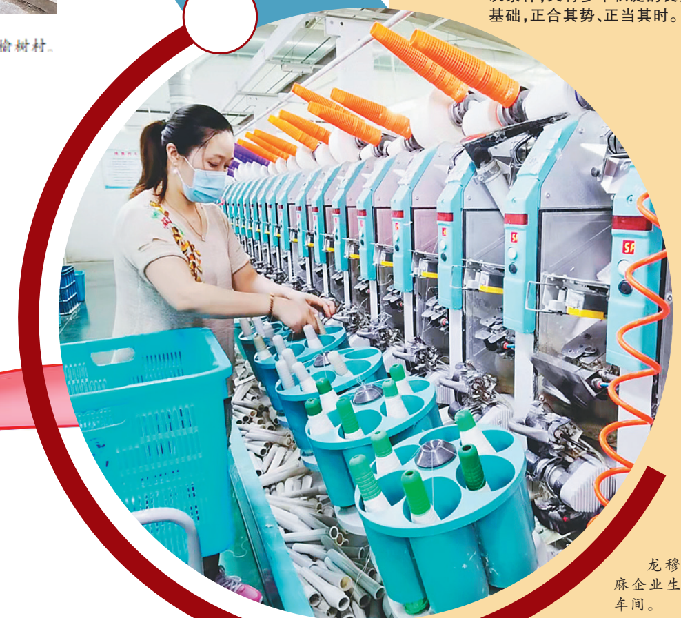
龙穆亚麻企业生产车间。