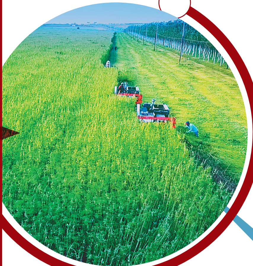
万亩亚麻收割场面。