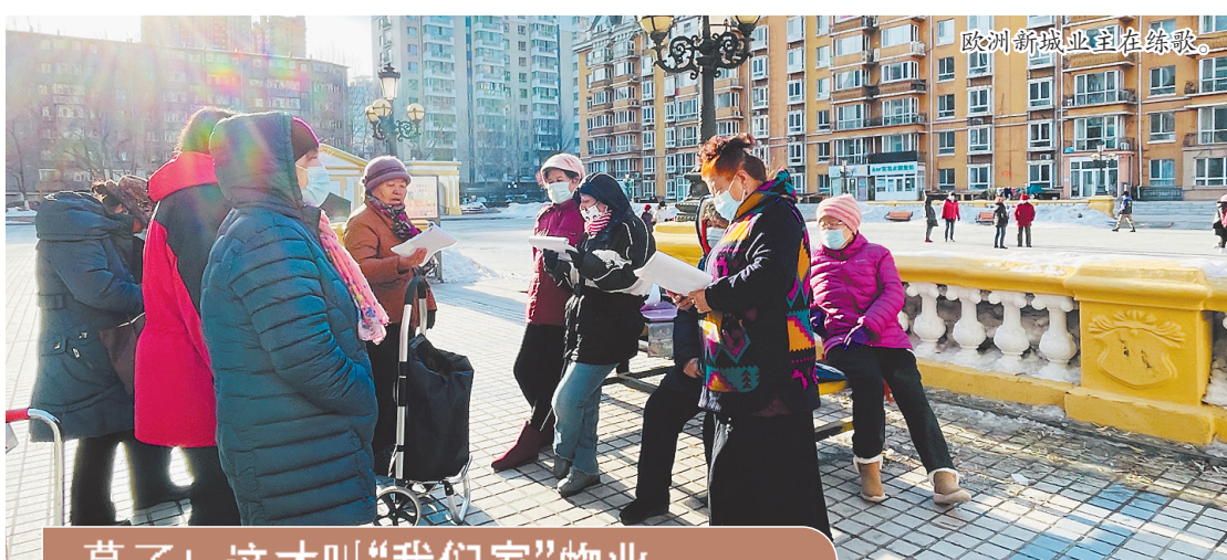
慕了!这才叫“我们家”物业