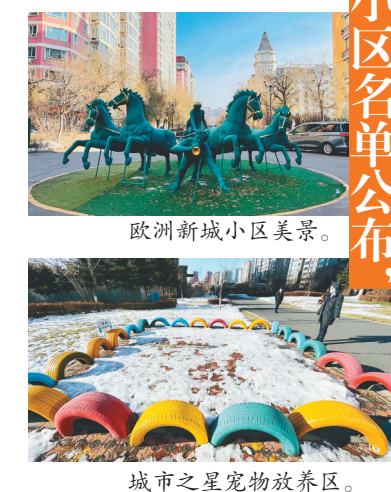
欧洲新城小区美景。

近日,我省公布了第一批“美好家园”小区名单,哈尔滨市“城市之星”和“欧洲新城”两个小区上榜。什么是“美好家园”?物业如何通过全方位高品质服务兑现承诺?业委会如何架起物业与业主之间的桥梁?业主之间如何和谐相处、互帮互助?日前,记者走进这两个小区进行了调查走访。