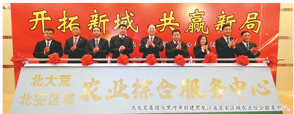
北大荒集团与黑河市创建黑龙江省首家区域农业综合服务中心。

在明年农业高质量发展中,鸭绿河农场有限公司将聚焦现代种业、黑土保护、智慧农业“三大工程”,全面落实以巩固提升粮食综合产能为主线,以“双控一服务”战略为统领,以深化经营体制机制改革为动力的“三大任务”,大力推进“六个替代”和“六个全覆盖”,持续提升农业生产综合服务功能,将饭碗牢牢端在自己手中。 面对面互动考试。