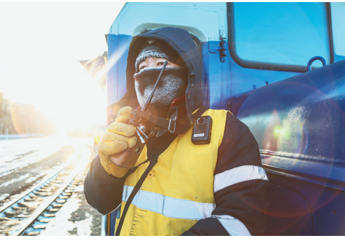
冒着风寒,兢兢业业。

为保障国际物流通道稳定畅通,绥芬河铁路口岸加强国际联运协调,严格落实疫情防控要求,积极配合口岸监管部门提高通关能力和作业效率,实现“无纸化通关”,加强班列运输组织和动态管理,实现中欧班列稳定增长。截至2021年12月27日,绥芬河站进出境中欧班列累计开行539列。