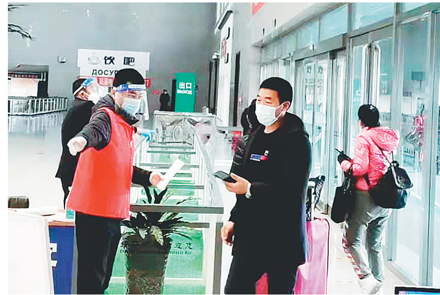
铁路候车厅里,为进站旅客提示相关扫码要求。

坚守防疫一线,充分彰显奉献担当。面对新冠疫情,绥芬河市发起“边城党旗红,防疫先锋行”主题活动,1800多名党员干部和300多名志愿者,走到街道、公园、广场、商超、企业、饭店,发放《防疫行为准则科普手册》和《预防新冠肺炎宣传单》,提醒市民严格执行“三宝”措施,发放并规范佩戴口罩,倡导“三不聚”,宣传本地防疫政策。机关工委先锋队捐赠口罩、消毒液等防护物资,送到宽沟、永胜、菜营三个村的农民家中。市委办先锋队到火车站、小城镇等室外人员聚集地,发放医用口罩和免洗消毒凝胶。税务局先锋队到社区,参加人员排查、配送物资等包保工作。口岸委先锋队还向俄方赠送1万只一次性医用口罩。“医共体”时代先锋队主动投身疫情防控和医疗救治,日夜奋战在急诊急救、发热门诊、隔离宾馆、公路铁路口岸采样点等一线场所,彰显责任担当。哪里有需要,哪里就有志愿者的身影,在全市构筑起先锋带头、群众响应、众志成城、群防群控的坚强防线。