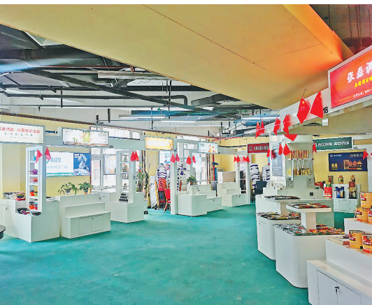
年创科技产业园内的餐饮食材展示中心

如何将餐饮文化融入旅游?刘春年建议:“杭州有中国杭帮菜博物馆,北京有御膳都皇家菜博物馆,哈尔滨也可以建设一家龙江餐饮文化博物馆,建设一条充满烟火气的餐饮文化街,一条老字号街、非遗街,集中展示黑龙江的各种美食和餐饮文化,充分利用声光电等手段,做一个能吃饭、能参观,又好吃又有历史感的场所,肯定能很受游客喜欢。”