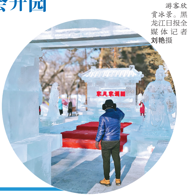
游客欣赏冰景。

术游园会通过免费提供雕刻用冰块、组织家庭冰雕比赛、为市民游客提供专业人士辅导等举措,让市民和游客乐享冰雪自然情趣。 开园时间为每日10时30分至20时。为确保广大游客的健康安全,园区严格按照哈尔滨市疫情防控有关要求,实施“限量、预约、错峰、一米线”入园,请市民和游客配合园区做好扫码测温工作。 服务进一步升级。本届冰灯艺术游园会设置了4台移动售卖车,增加了游客服务中心,市民和游客无需担心找不到地方取暖,也不用自带餐食,在园区内就能品尝到各式美食和网红小吃。 哈尔滨冰灯艺术发源地。哈尔滨冰灯艺术游园会自1963年创办,迄今已经走过了58年的光辉历程,与哈尔滨冰雪大世界、太阳岛雪雕艺术博览会珠联璧合,共同缔造了哈尔滨冰雪艺术的美丽传奇。