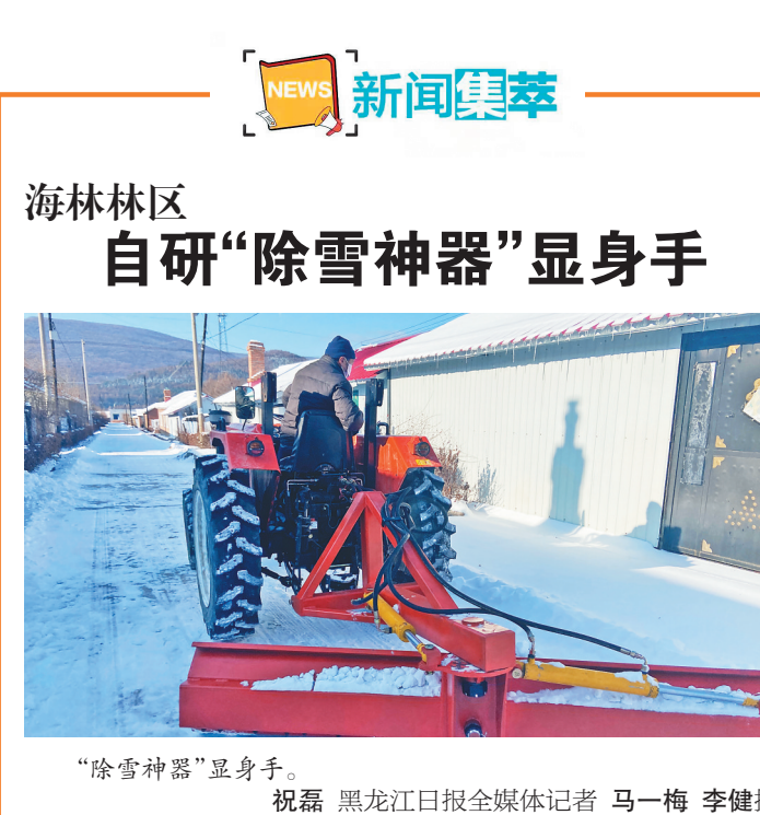
“除雪神器”显身手。

预计到2022年4月15日前，东方红局将数据源和模块与建设方完成“精准”对接，实现运用数字化手段对林业立体化、信息化、智能化管理的目标。