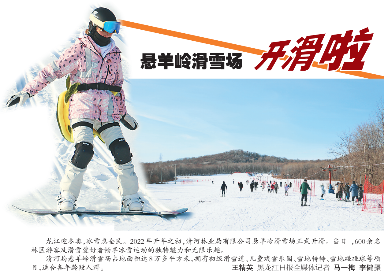
龙江迎冬奥，冰雪惠全民。2022年开年之初，清河林业局有限公司悬羊岭滑雪场正式开滑。当日，600余名林区游客及滑雪爱好者畅享冰雪运动的独特魅力和无限乐趣。 清河局悬羊岭滑雪场占地面积达8万多平方米，拥有初级滑雪道、儿童戏雪乐园、雪地转转、雪地碰碰球等项目，适合各年龄段人群。

未来，黑林职将继续全力打造技术技能人才培养高地和创新服务平台。将家具智能制造、生态林业两个高水平专业群建成全省样板，努力培养大批具有专业技能和“工匠精神”的高素质技术技能人才，为区域经济社会发展和龙江生态文明建设作出新的贡献。