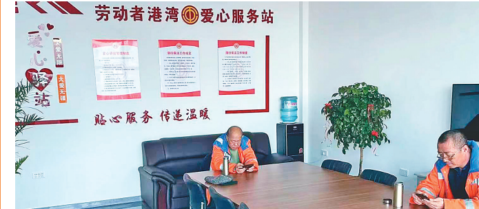
环卫工人在爱心驿站休息。

本报讯(张秉一 李金峰 黑龙江日报全媒体记者马一梅 李健)“林区工会为我们重新升级打造的新的休息室，设备一应俱全，非常暖心。”八面通林区环卫队队长麻海波说。