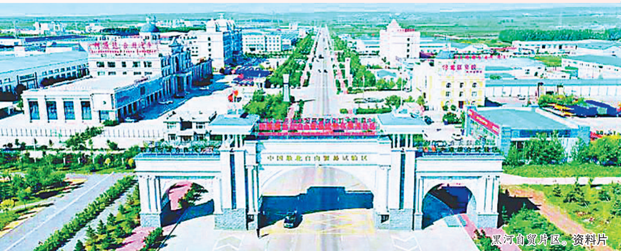
黑河自贸片区。资料片

展开中国地图,黑龙江是中国东北角。再看世界地图,这里却是东北亚中心,是中国向北开放的重要窗口。如何发挥黑龙江的区位优势,让对外开放之门更宽阔,环境更优越,构筑我国北方开放新高地?这成了今年两会上人大代表们热议的话题。