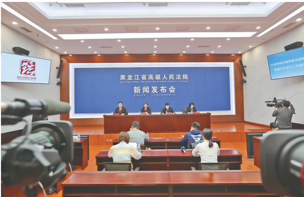
全省铁路运输两级法院行政区域管辖行政案件改革工作新闻发布会。