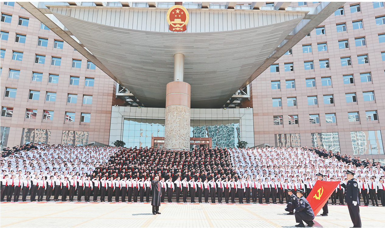
省法院千名干警向党旗宣誓,省法院党组书记、院长石时态领誓。