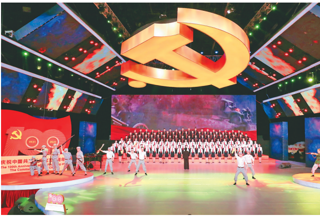
省法院干警参加省直属机关文艺汇演。

2021年,收案106.9万件,同比增长67%,结案103.5万件,同比增长56.9%,全省法院收、结案数双双突破百万大关,创历史新高,增量、增幅均居全国第二。其中,省法院收案13691件,同比增长44.1%;结案13141件,同比增长38.7%。全省各级法院干警勠力同心,审结刑事案件2.6万件,民事商事案件61.9万件,全省法官人均结案193件,完成为群众办实事150项,群众满意度100%。