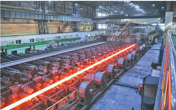
建龙公司生产的无缝钢管。