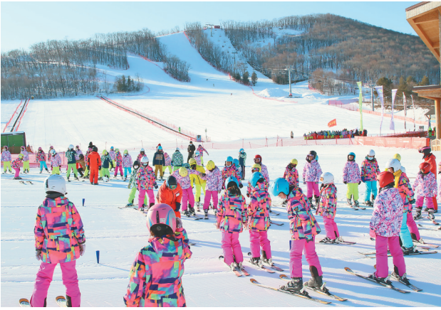
万名青少年上冰雪。

加快民主法治进程。大力支持人大及其常委会依法行使职能、人大代表依法履职,充分发挥人民政协政治协商、民主监督和参政议政作用,促进宗教和谐稳定,巩固和发展最广泛的爱国统一战线,充分调动民主党派、工商联和无党派人士积极性,凝聚一切可以凝聚的智慧,团结一切可以团结的力量。发挥桥梁纽带作用。组织工会、共青团、妇联等群团组织紧密服务群众,团结带领广大群众在发展一线建功立业。支持关工委、老科协、老促会等社团组织贯彻市委决策主张,发挥“五老”作用。