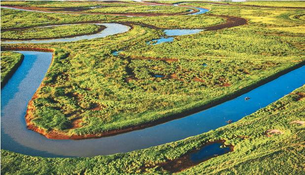
万顷湿地成为双鸭山旅游资源。