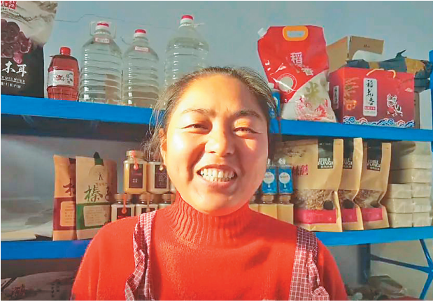
农民在家做起电商。