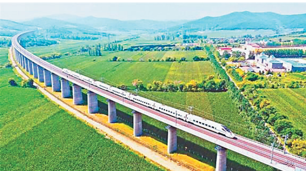
杜佳客专开通,双鸭山有了高铁。