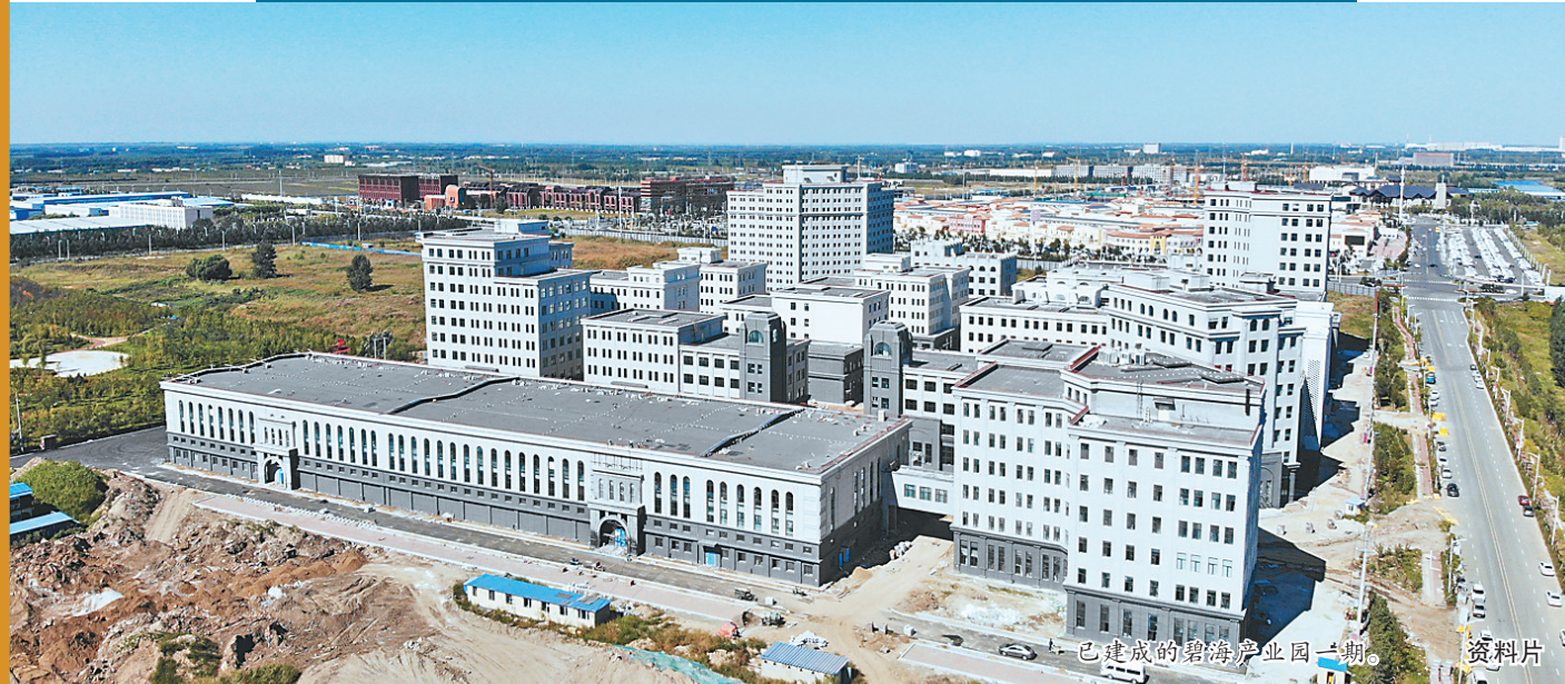
黑龙江日报全媒体记者 薛婧 李爱民

连日来,在哈尔滨电气集团海洋智能装备有限公司(简称海洋智装)宽敞明亮的生产车间内,技术人员正忙着装配样机产品,为早日投产做准备。作为哈尔滨新区碧海产业园首家入驻企业,海洋智装的快速推进,标志着碧海产业园建成投用,并全面进入招商阶段。