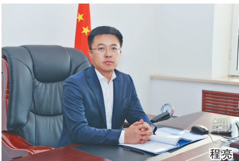
黑龙江日报全媒体记者 周静

2021年,宁安市构建“1+2+6”招商体系,创新实施“乡情招商”专项行动,组建乡情招商基地、开展乡情招商活动、签约乡情项目、建立人才数据库,吸引优秀乡友回乡投资兴业,全年共组织举办乡情招商活动71场,签约项目77个,签约额51.78亿元,推送66个招商项目,搜集重点企业库企业169家。