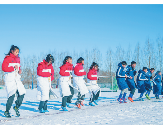
梅里斯达斡尔族区教育局以“鹤城冰雪季助力冬奥会”为主题,举办了丰富多彩的冰雪活动,既锻炼了学生的身体素质,也为校园文化增添了活力。

目前,全区拥有青听蔬菜种植专业合作社和威鹏果蔬种植农民专业合作社,他们大力发展“互联网+农业”,2021年销售额达到80万元。齐重数控、齐二机床、景宏石油、华工机床等装备龙头企业做强远程运维、数字车间、工业互联网板块,加快在数字工业、智能工业领域布局。齐齐哈尔鹏力科技有限公司投资5578.83万元,建成乳品包装绿色降解吸管数字化车间,形成信息系统、智能装备、绿色产品以及智慧检测之间的有效集成和信息的互联互通。同时,该区努力提高数字政府服务效能,突出服务、治理、运行三条主线,努力整合“e网通”、秸秆禁烧智能监控、明厨亮灶、政府网站等平台资源,实现数据集中和共享,提升“一网通办”水平和“一网统管”效能。