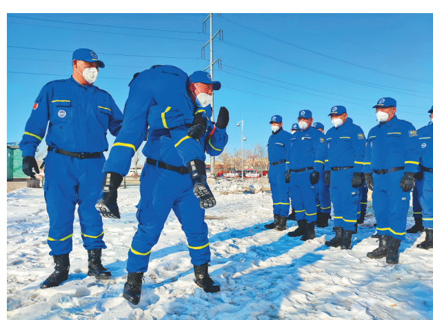
近日,齐齐哈尔市首家民政部门注册的民间专业化公益救援队——蓝天救援队成立,填补了鹤城没有民间专业化公益救援队的空白。救援队将面向社会、学校、企事业单位开展减灾应急培训、大型公益活动保障与公益救援、救灾活动,保障和减少灾害和事故造成的财产和生命损失。

建华区将民需作为开展网格化管理服务的根本依据,听取街道社区不同声音,掌握居民需求第一手情况,完善了多项配套制度,确保网格建设务实管用,贴近民需。全区把解决人民群众需求问题作为管理服务突破口,构建“网片一体化”新体系,组建网格和部门下沉人员在内的1284人网格服务队伍,7个街道、34个社区、297个城镇居民网格解决居民实际问题17462件,办结率97%。