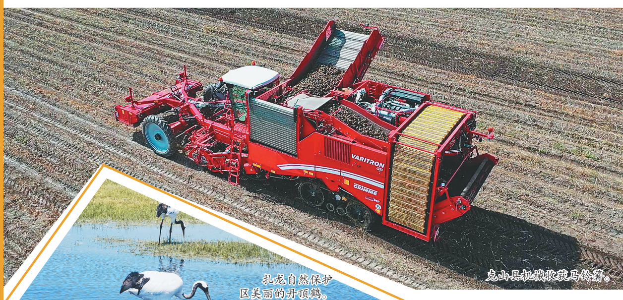
扎龙自然保护区美丽的丹顶鹤。

中国共产党齐齐哈尔市第十四次代表大会日前闭幕,会议总结了过去五年的发展成绩,为鹤城未来五年发展指明了道路,绘就了蓝图,振奋了人心。未来,齐齐哈尔将聚焦构建现代产业体系,在老工业基地转型升级上实现新跨越;聚焦农业农村现代化,在推动乡村振兴上实现新跨越;聚焦绿色低碳发展,在生态文明建设上实现新跨越等方向聚焦发力,建设美丽鹤城。