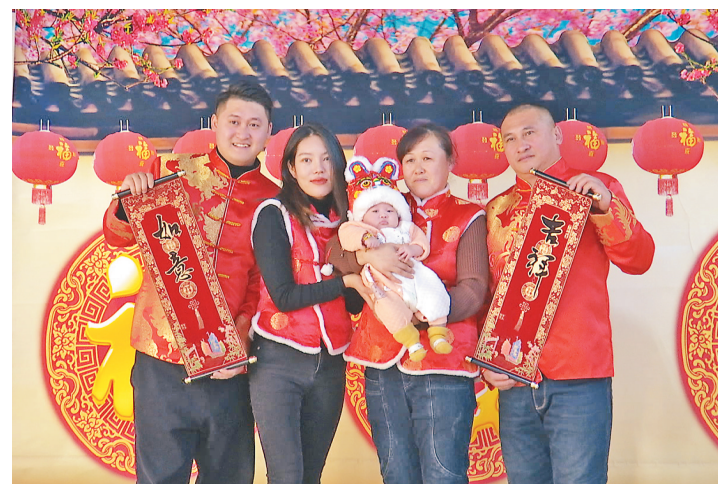
定格时间,凝聚亲情。