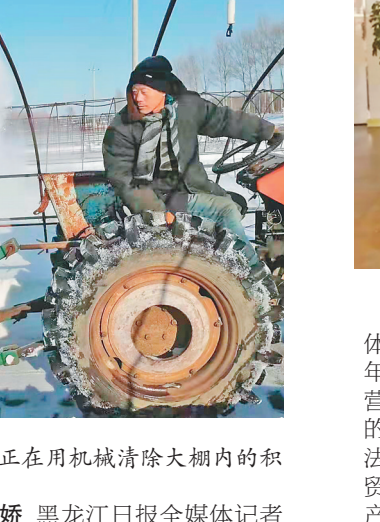
农民正在用机械清除大棚内的积雪。