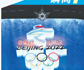
雪花花灯点亮“冬”字会徽。