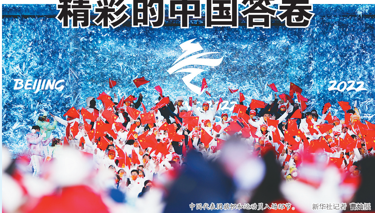
中国代表团旗手和运动员入场环节。