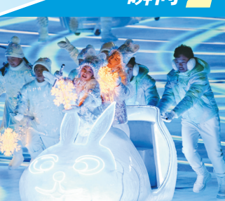
十二生肖造型冰车驶入场内。