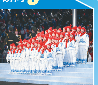
山区孩子演唱《奥林匹克颂》。