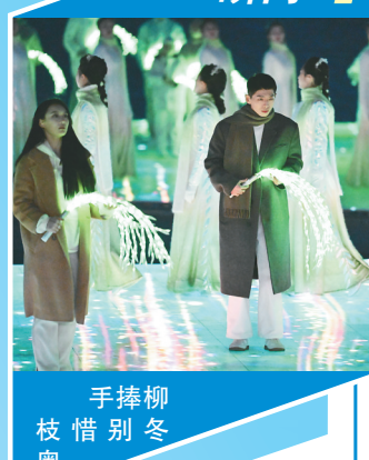
手捧柳枝惜别冬奥。