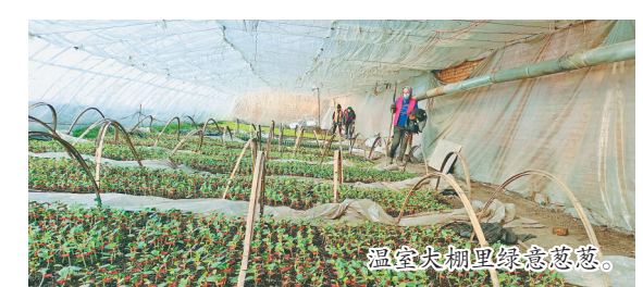
温室大棚绿意盎然。