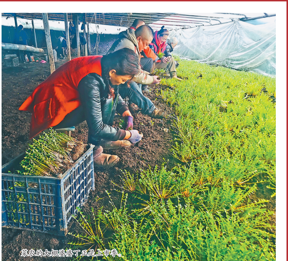
菜农的大棚婆婆丁正陆续上市。

发力推进乡村振兴,目前,半截河子村正倾力打造集旅游、采摘、住宿为一体的乡村旅游项目及观光农业示范项目,推进村级蔬菜采摘基地建设,同时加快发展农村专业合作社经济组织,推进绿色蔬菜规模化、集约化、产业化,做强“一村一品”。