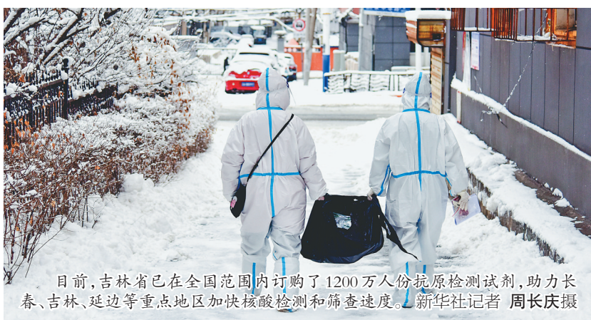
目前,吉林省已在全国范围内订购了1200万人份抗原检测试剂,助力长春、吉林、延边等重点地区加快核酸检测和筛查速度。