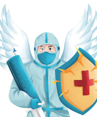
新冠肺炎疫情防控工作,筑牢疫情防控屏障。

日本气象厅设定的地震震度共10个等级,由弱到强分别为0至4级、5弱、5强、6弱、6强和7级。