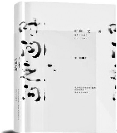
《时间之间》/李皓/春风文艺出版社/2021年12月