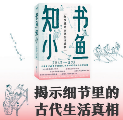
2023年12月 北京联合出版有限公司 《知小鱼》/流沙河