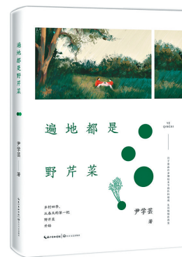
《遍地都是野芹菜》 尹学芸 长江文艺出版社 2021年12月

本书以一个脱离乡村的姑娘儿的人生轨迹为主线,记录了丰富多彩的乡村生活。在这一主题下,以有农耕味道的“季”作为章节标题,以季节的流转指涉时代的前进与变化,通过记述村里的人和事,描绘温暖有力的乡村生活图景和对未来的憧憬。