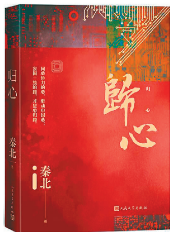
《归心》/秦北/人民文学出版社/2021年3月

主编:文天心 责编:曹晖 执编/版式:陆少平 美编:倪海连 投稿邮箱 ds84655582@163.com