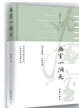
《画室一洞天》 冯骥才 2022年1月 作家出版社

本书是著名作家潘向黎最新的一部关于古诗词的随笔集。书中十二讲,聚焦陶渊明、杜甫、李商隐、晏殊、晏几道、欧阳修、苏轼、周邦彦、陆游、辛弃疾等文人。作者匠心独运,执著探寻古人所思所想,古典诗词与人生真味水乳交融。