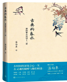
《古典的春水:潘向黎古诗词十二讲》 潘向黎 人民文学出版社 2022年3月

本书以一个脱离乡村的姑娘儿的人生轨迹为主线,记录了丰富多彩的乡村生活。在这一主题下,以有农耕味道的“季”作为章节标题,以季节的流转指涉时代的前进与变化,通过记述村里的人和事,描绘温暖有力的乡村生活图景和对未来的憧憬。