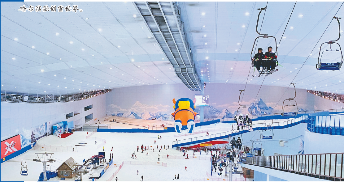
哈尔滨融创雪世界。

《黑龙江省文化旅游产业招商引资若干扶持政策措施》出台如石投水,在黑龙江投资文旅产业项目的企业家群体中引起了阵阵涟漪。记者采访中,几家黑龙江重量级文旅项目的负责人难掩激动心情。如何有效运用招商引资扶持政策助力自身发展,一时间成为龙江文旅企业和业内人士的热门话题。