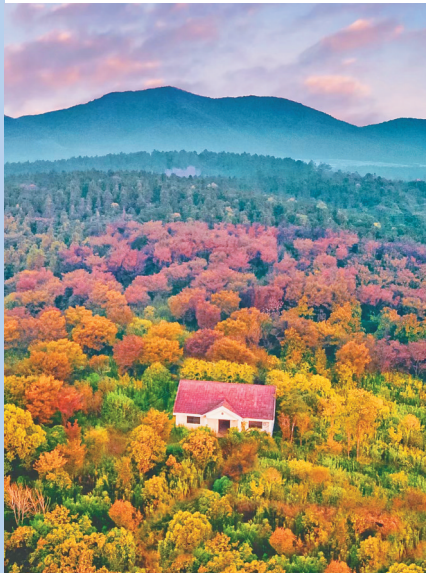
大亮子河国家森林公园。