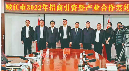
2022年招商引资暨产业合作签约仪式现场。

嫩江市力争到今年底,引进项目40项,其中引进固定资产投资5000万元以上生产加工类项目30个。