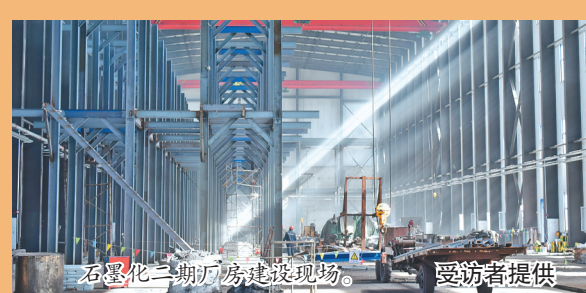
石墨化二期厂房建设现场。