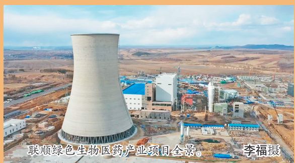
联顺绿色生物医药产业项目全景。