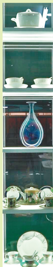
大庆智陶瓷业有限公司产品展示。美国强摄