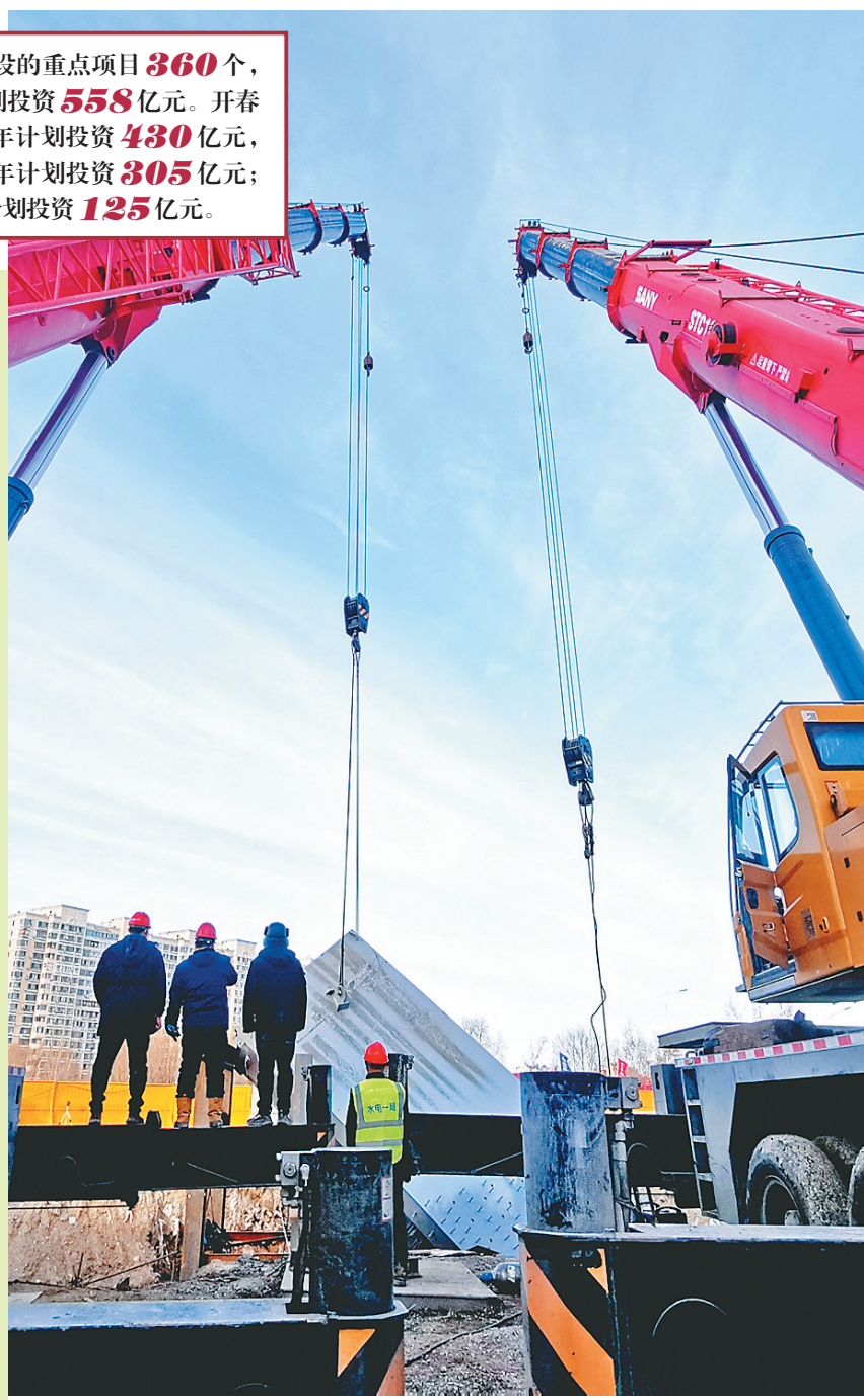
大庆市滨水绿道项目正在加紧建设中。