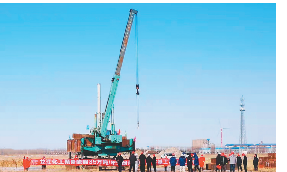
大庆“油头化尾”新建项目第一桩。

“目前,园区已为项目配套建设了给水、污水处理、工业管廊、原料末站等工程,正在配套建设铁路专用线、电力、蒸汽管线、危化品停车场等。”施工现场人员说:“所有配套工程,将于2023年上半年全部完工,满足项目投产需要。”