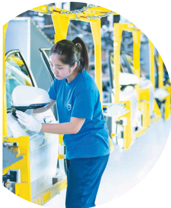
工人在现代化的沃尔沃汽车生产线上。

今年以来,大庆市已落实投资1000万元以上重点项目360个,占全口径项目94%,总投资1339亿元,单个项目平均年度计划投资1.6亿元。其中产业项目200个,总投资1024亿元,年度计划投资444亿元,占全部项目年度计划投资的79%。纳入省级重点项目45个,比去年多16个,总投资672亿元,年度计划投资344亿元,单个项目平均年度计划投资7.6亿元。