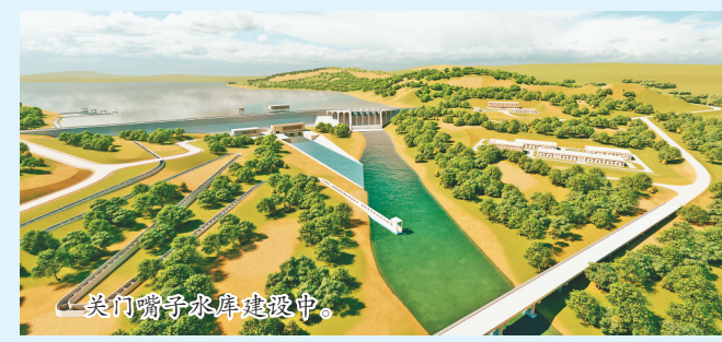
关门嘴子水库建设中。