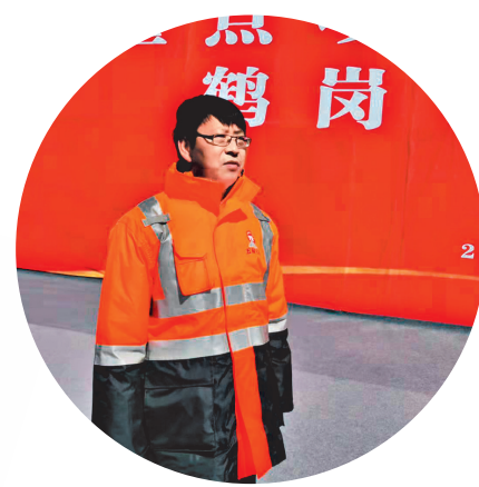
黑龙江日报全媒体记者 王白石 王宗华

“曾经有人说‘投资不过山海关’，但中国五矿在鹤岗市和萝北县的投资实践中却深刻感受到，我们投资在这里是对的！鹤岗为我们创造了良好的投资环境，为我们灵活制定政策、合理配置资源、有针对性地提供服务，全方位保障了五矿石墨产业投资项目的顺利推进，增强了我们在鹤岗长期投资的信心。”