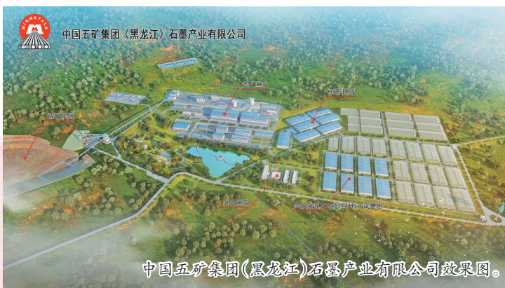
中国五矿集团（黑龙江）石墨产业有限公司效果图。

近期，鹤岗市发改委为鹤岗市31户疫情防控重点保障企业，争取政策性优惠贷款7.97亿元；将兴汇粮食加工有限公司等24户企业纳入国家疫情防控重点保障企业名单，涵盖医药物资、粮食企业、生物医药、生活物资和物流运输等领域；为鹤岗市嘉润能源有限公司和中海石油华鹤煤化有限公司两户煤化工企业，争取了省财政对疫情期间企业新增贷款支付利息的50%贴息支持。