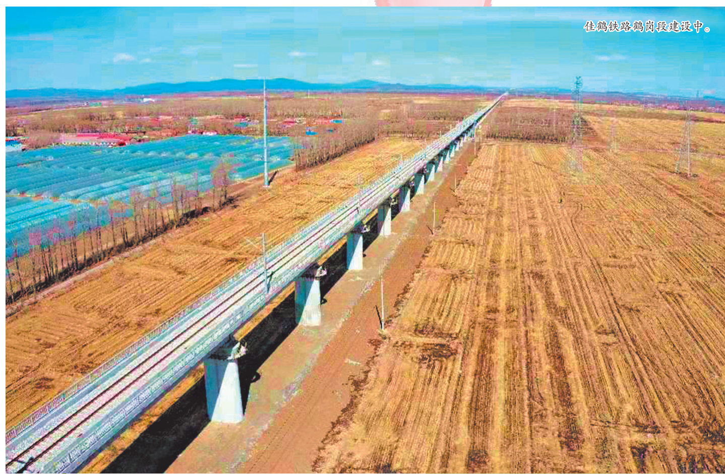
佳鹤铁路鹤岗段建设中。

“产业兴市、融合强市、生态立市、开放富市”，鹤岗市第十三次党代会确立了四大战略，聚焦“煤炭、石墨、现代农业、绿色产业、战略新经济、发展新业态”六个产业主攻方向，努力打造“产业转型示范城，生态和谐宜居城”的转型发展新思路。“产业兴市”列首，“产业转型示范城”为目标，一首启一目标，均立足“产业”根基。