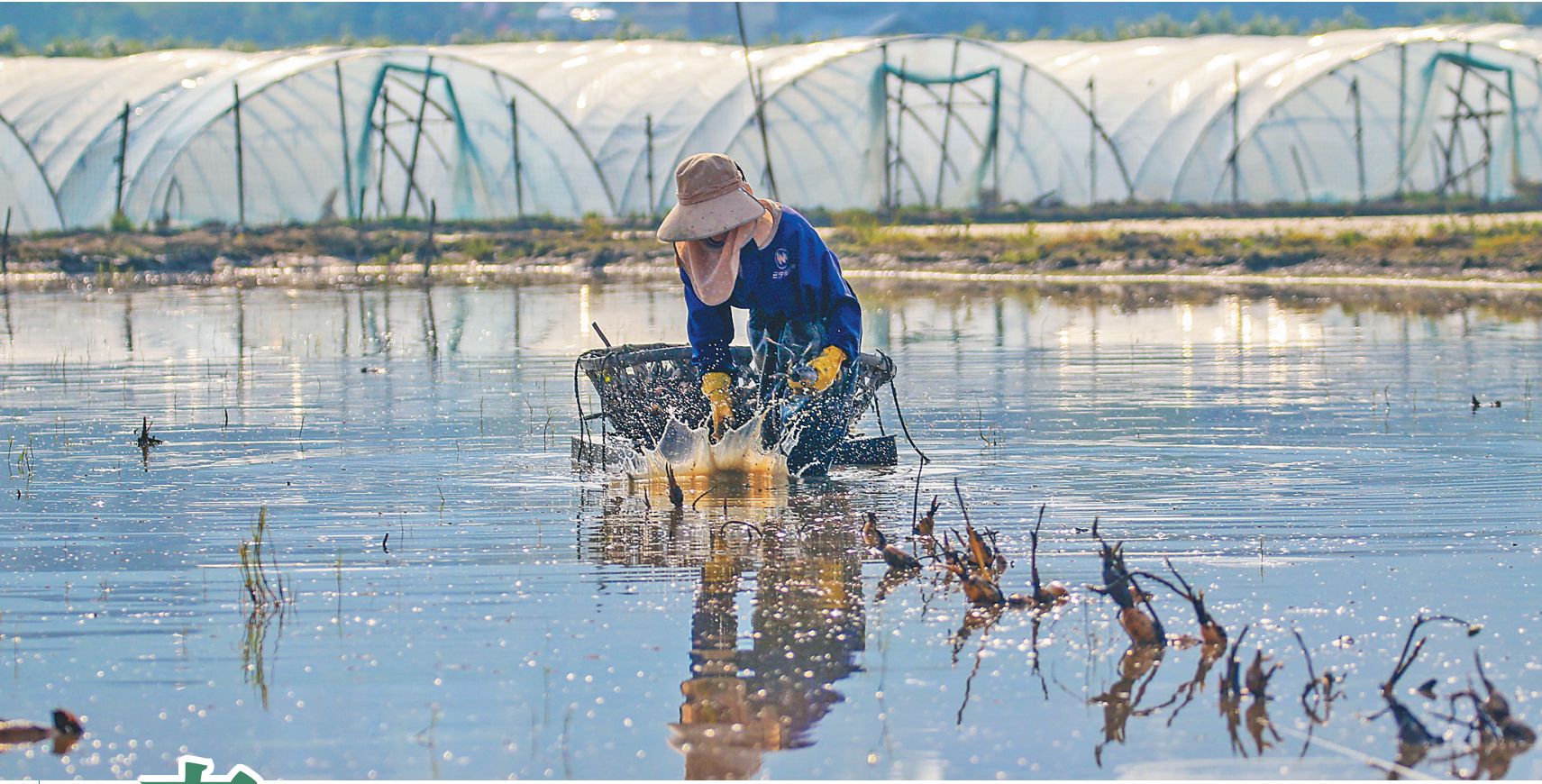
4月11日,湖南省湘西土家族苗族自治州龙山县石羔街道中南社区农民在田间栽种莲藕。阳春三月,各地农民抢抓农时开展农业生产,田间地头一派繁忙景象。

新华社北京4月11日电(记者姜琳)为支持企业生产经营,保持就业局势稳定,人力资源和社会保障部近日印发《关于加强企业招聘用工服务的通知》,从九方面部署做好企业招聘用工服务。